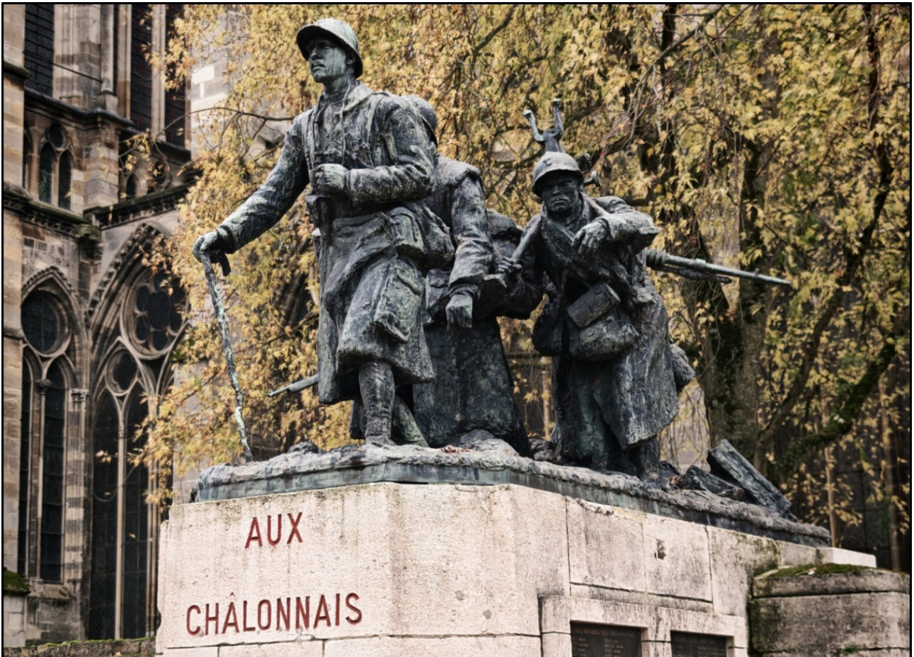
Monument aux Morts de Châlons-en-Champagne.

Joost Op't Eynde, l'un des auteurs de l'étude, souligna que cette découverte pouvait avoir des implications pour la conception des casques militaires modernes, à une époque où les lésions cérébrales traumatiques causées par le blast des explosions.