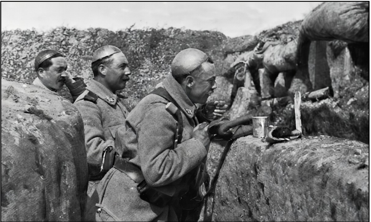
Soldats dans une tranchée portant une cervelière.

La cervelière représentait un progrès réel mais limité. Elle ne protégeait qu'une partie réduite du sommet du crâne et s'avérait extrêmement inconfortable. Difficile à positionner correctement sous le képi, elle glissait, provoquait des maux de tête intenses et ne disposait d'aucun système d'aération. De nombreux soldats la portaient finalement à même le crâne ou par-dessus le képi, quand ils ne la reconvertissaient pas en récipient pour les cartouches ou en ustensile de cuisine. Malgré ses défauts, la cervelière réduisait d'environ 60 % les blessures par éclats au sommet du crâne, ce qui démontrait l'intérêt fondamental d'une protection métallique de la tête.