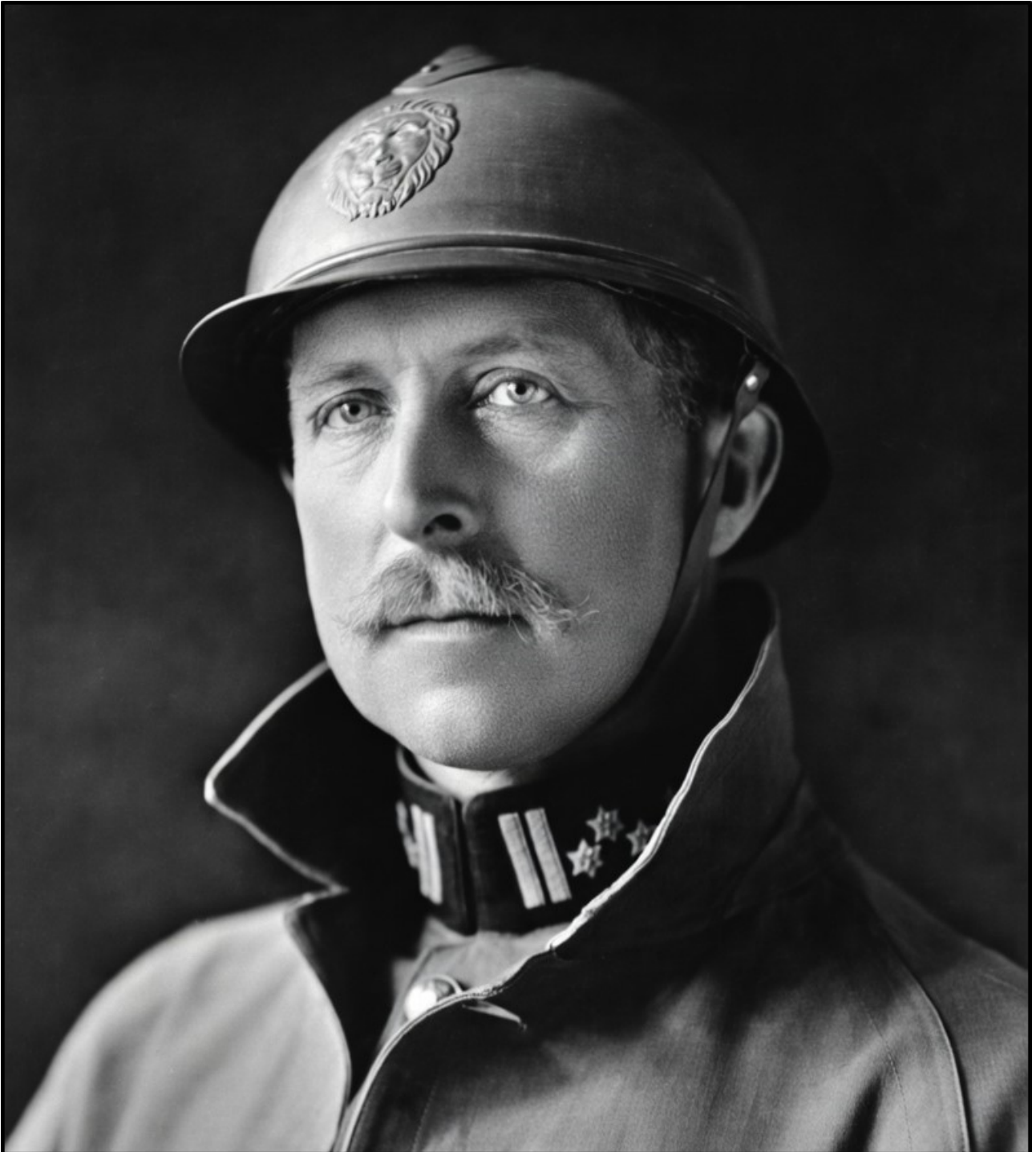
Roi des Belges Albert Ier (1875-1934).