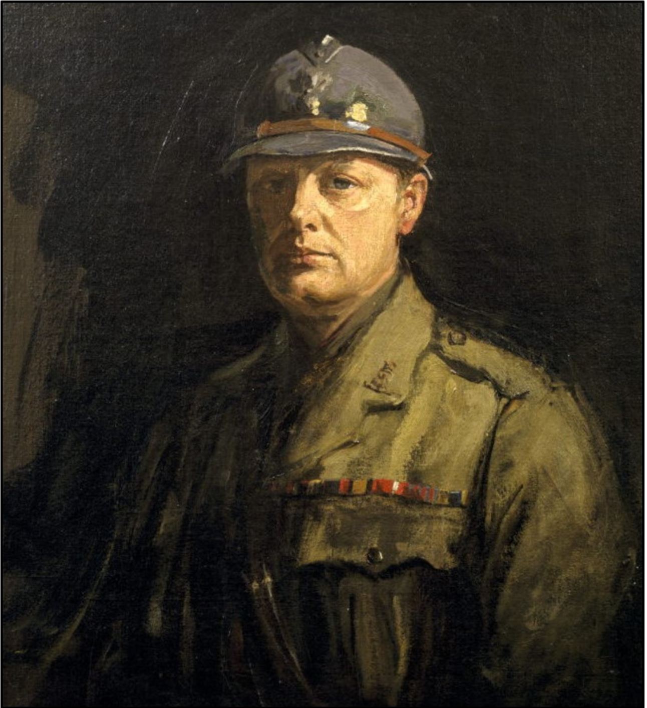
Portrait de Winston Churchill portant un casque Adrian offert par le général Fayolle.

15 avril 1915 : le jour où l'officier intendant Adrian sauva des centaines de milliers de poilus.