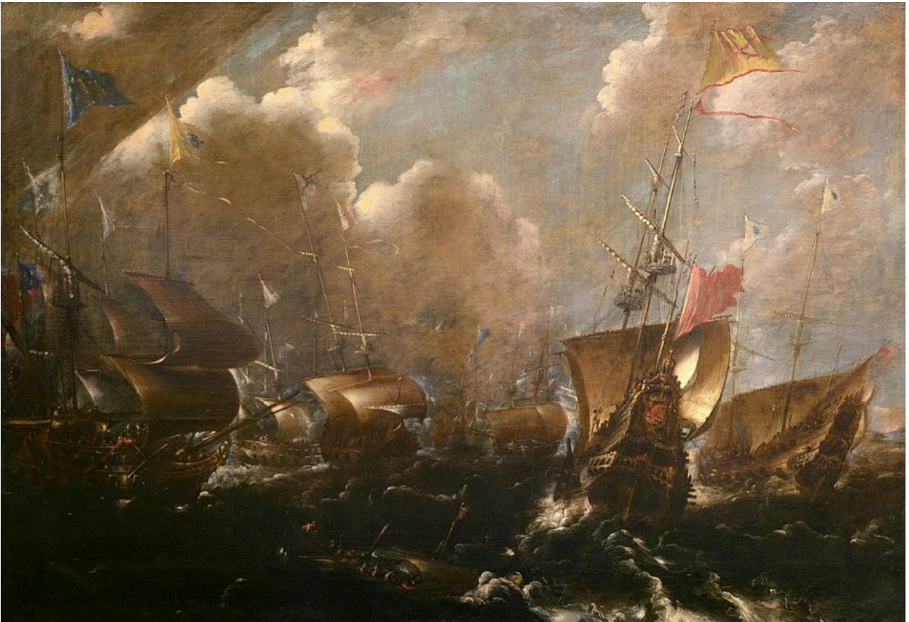
Bataille navale de Guétharia, 22 août 1638, par Andries van Eertvelt, qui fut la première victoire significative pour la marine française nouvellement formée.