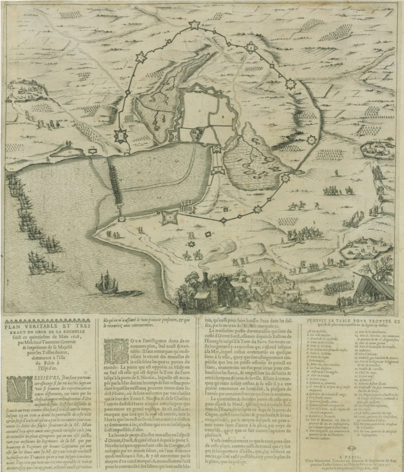
Plan du siège de La Rochelle réalisé le 15 mars 1628.