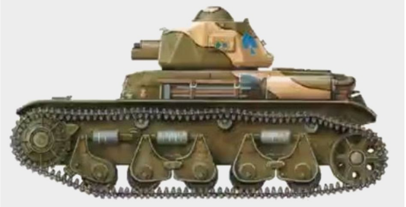
Char Renault R35, 1ère Cie, 24e BCC, 4e DCR.