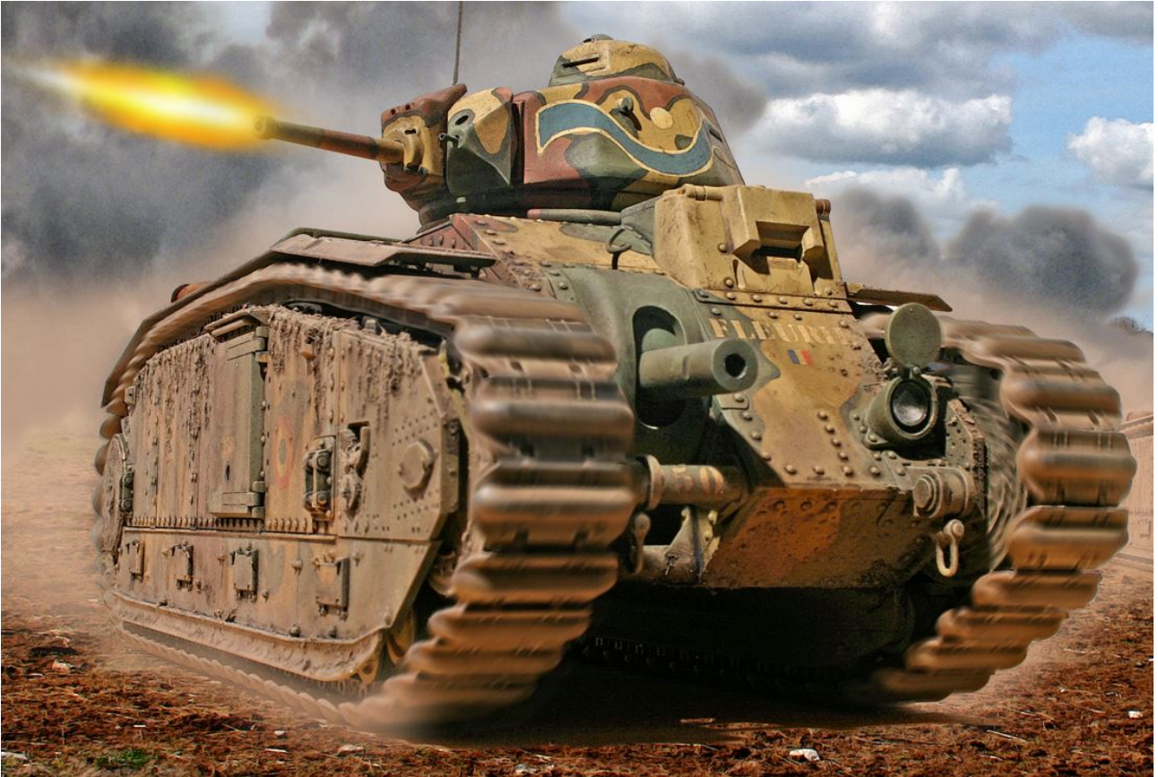
Char Renault B1 Bis