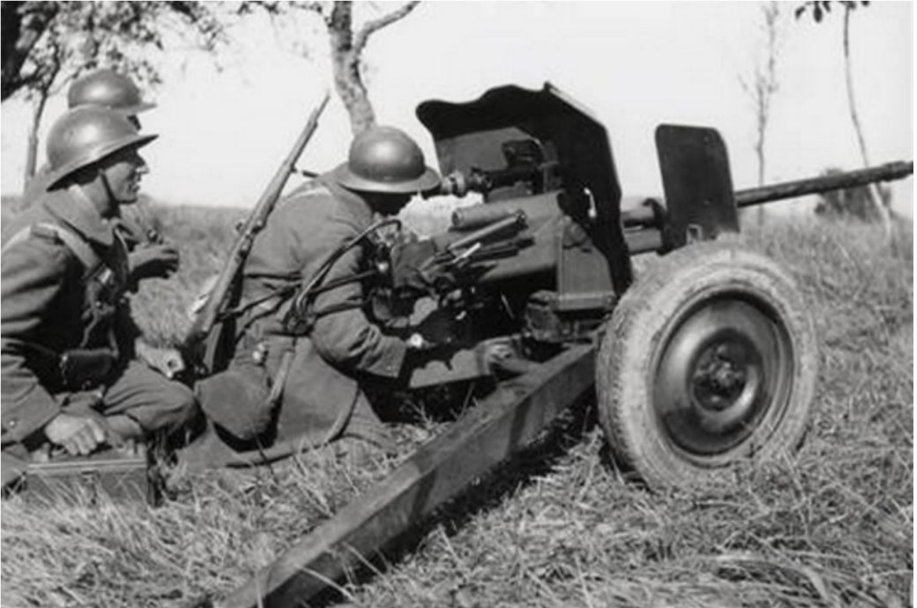
Canon antichar Hotchkiss 25 mm

La compagnie du 2 e BCC se dirige vers Boncourt et va reconnaître Dizy-le-Gros, à l'est du dispositif d'attaque.