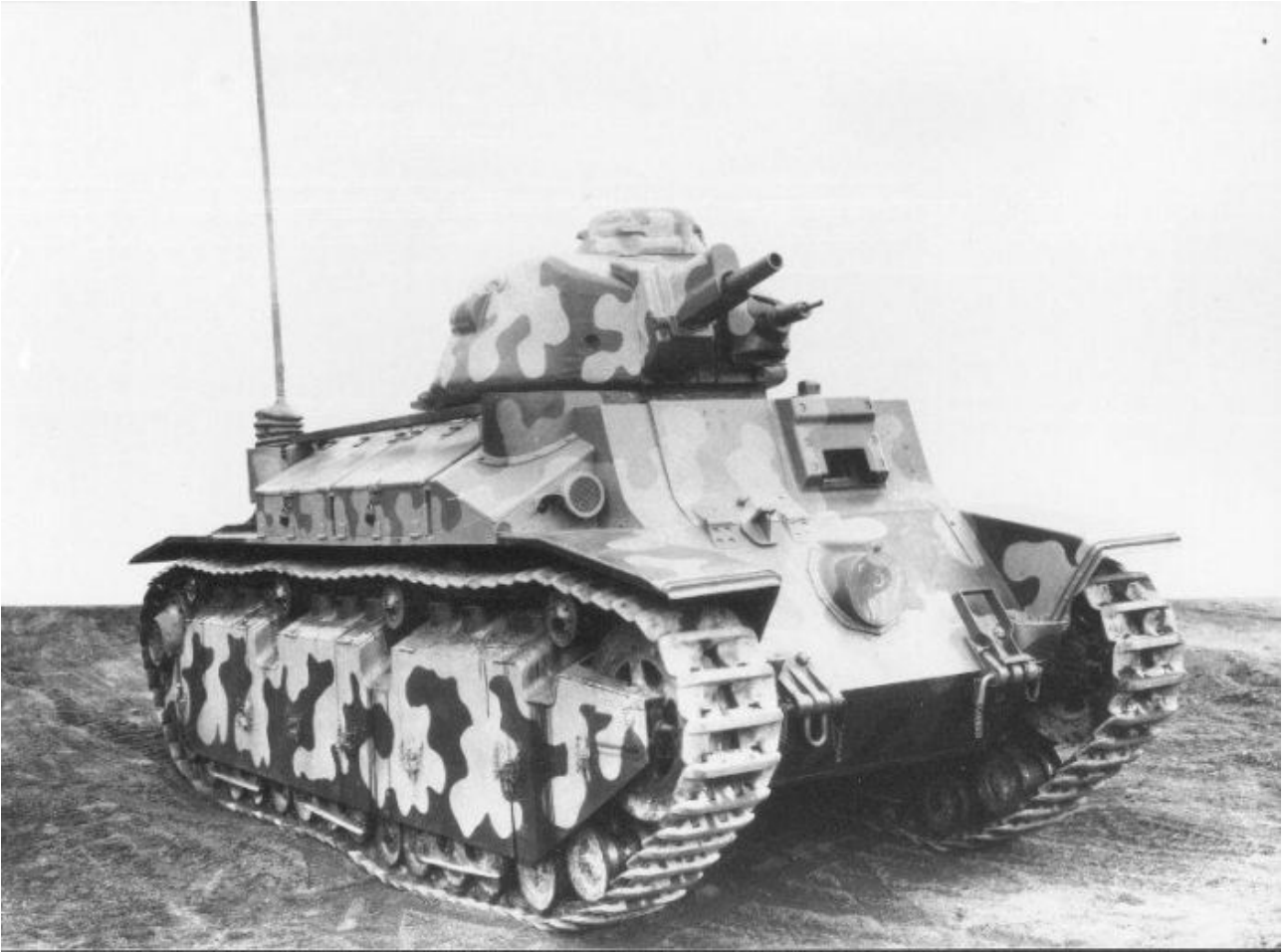
Char moyen Renault D2