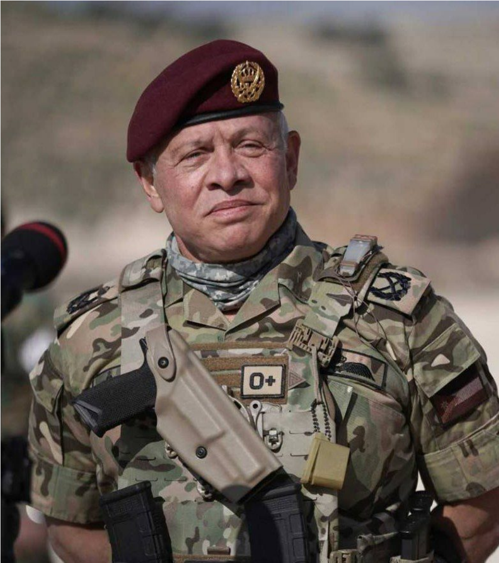
Roi Abdallah II de Jordanie.

En 2009, le Centre de formation aux opérations spéciales du roi Abdallah II (« King Abdullah II Special Operations Training Center » - KASOTC) devient opérationnel. Construit par les États-Unis, le centre s'étend sur 25 kilomètres carrés et dispense des formations techniques et tactiques constamment actualisées en matière de lutte anti-terroriste, d'opérations spéciales, de guerres irrégulières. Chaque année, des forces spéciales étrangères sont invitées au « Warrior Competition » pour tester leurs compétences respectives et présenter les innovations technologiques.