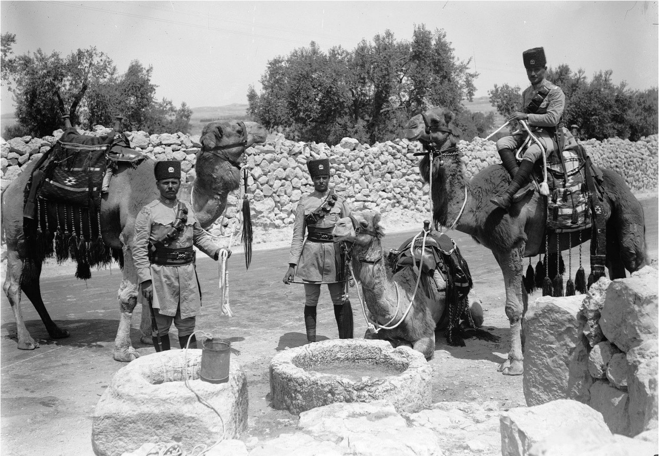
Transjordan Frontier Force. Photo prise entre 1934 et 1939.