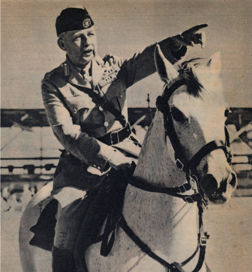
John Gabot Glubb (1897-1986).

En décembre 1930, le major John Bagot Glubb (4) , qui possède de solides connaissances sur les coutumes bédouines, est versé au sein de la Légion arabe comme commandant en second. L'année suivante, il crée la Patrouille du désert , exclusivement composée de bédouins, afin de lutter contre les raids entre tribus qui cesseront en 1932. Il persuade la TJSF de se retirer du désert au profit de cette patrouille d'une vingtaine d'hommes équipée de quatre camions et armée de mitrailleuses Lewis et Vickers. Les hommes portent le keffieh à damier rouge et blanc, qui sert aux bédouins à se protéger du vent, du soleil et du sable, et qui devient ainsi un élément identitaire de leur uniforme.