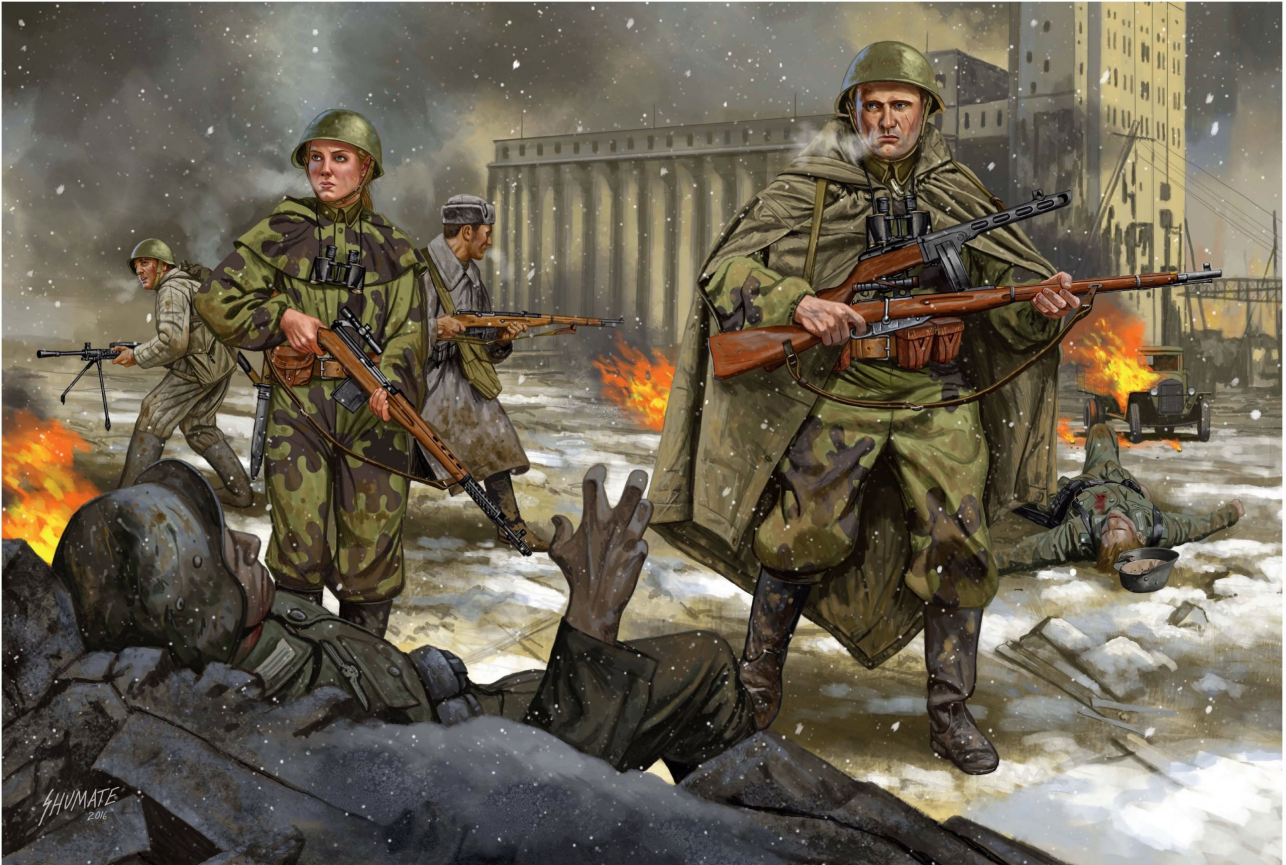
Illustration de Johnny Shumate.