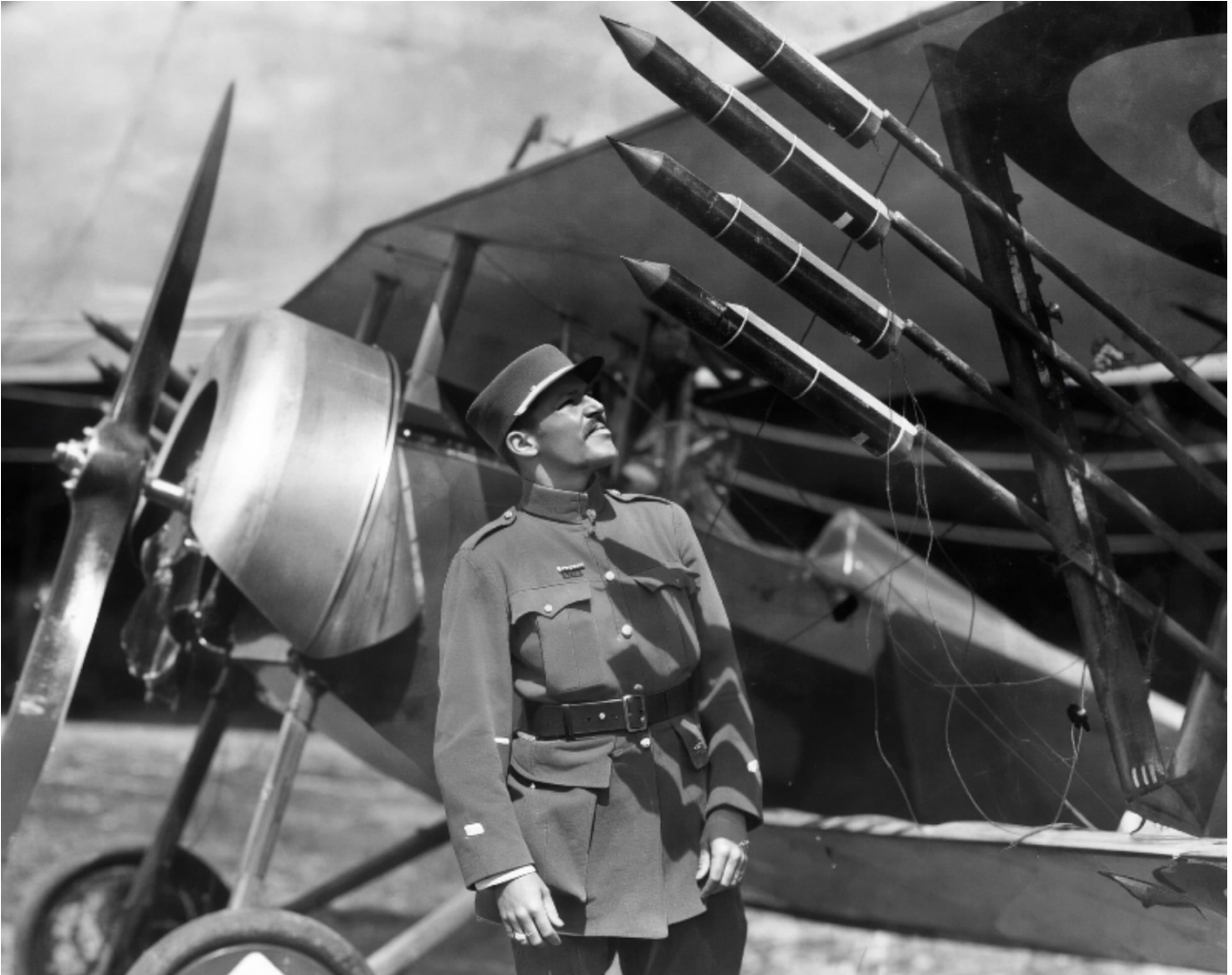
Le pilote américain Norman Prince (escadrille La Fayette) examinant des fusées Le Prieur.