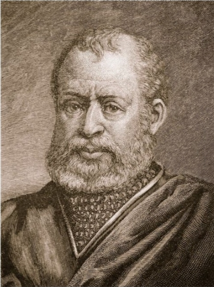
Georg von Frundsberg.

En janvier 1525, une armée impériale de secours, forte d'environ 23 000 hommes, arrive en vue de Pavie sous le commandement nominal du vice-roi de Naples, Charles de Lannoy, flanqué de Fernando de Ávalos, marquis de Pescara, et de Georg von Frundsberg, chef des lansquenets allemands. Le commandement effectif revient largement à Pescara, officier d'expérience formé aux guerres d'Italie. L'armée de secours s'installe à quelques kilomètres au nord-est de la ville. Une situation de double siège s'instaure alors : les Français assiègent Pavie tandis qu'ils sont eux-mêmes contenus par l'armée de secours.