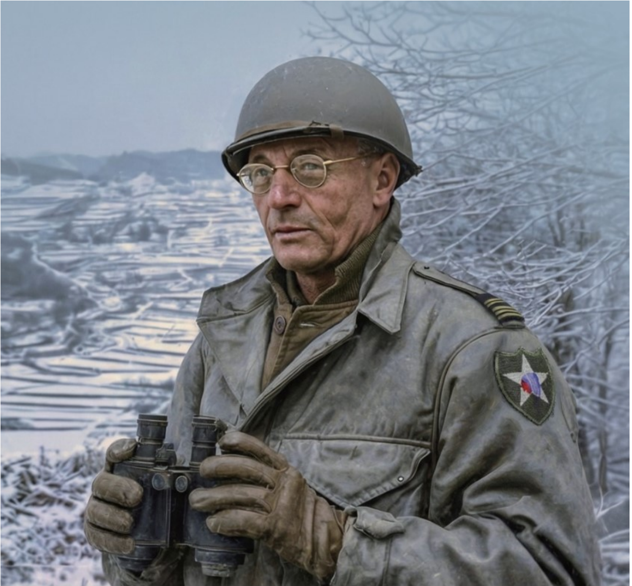
Monclar. Détail d'une affiche coréenne 2026 de commémoration.

La France, déjà engagée militairement en Indochine, ne déploie pas de contingent terrestre dès le déclenchement du conflit. Sa première contribution est navale : l'avisos colonial La Grandière , rappelé du golfe du Siam, est intégré aux forces navales de l'ONU et participe notamment au débarquement d'Incheon, le 15 septembre 1950. Le gouvernement dirigé par René Pleven, sous la présidence de Vincent Auriol, décide ensuite la formation d'une unité terrestre. Le bataillon français de l'ONU (BF/ONU) est créé le 25 août 1950, constitué de « volontaires » [1] issus de l'armée d'active, des réserves et de l'Union française. Il se forme à l'automne au camp d'Auvours, dans la Sarthe.