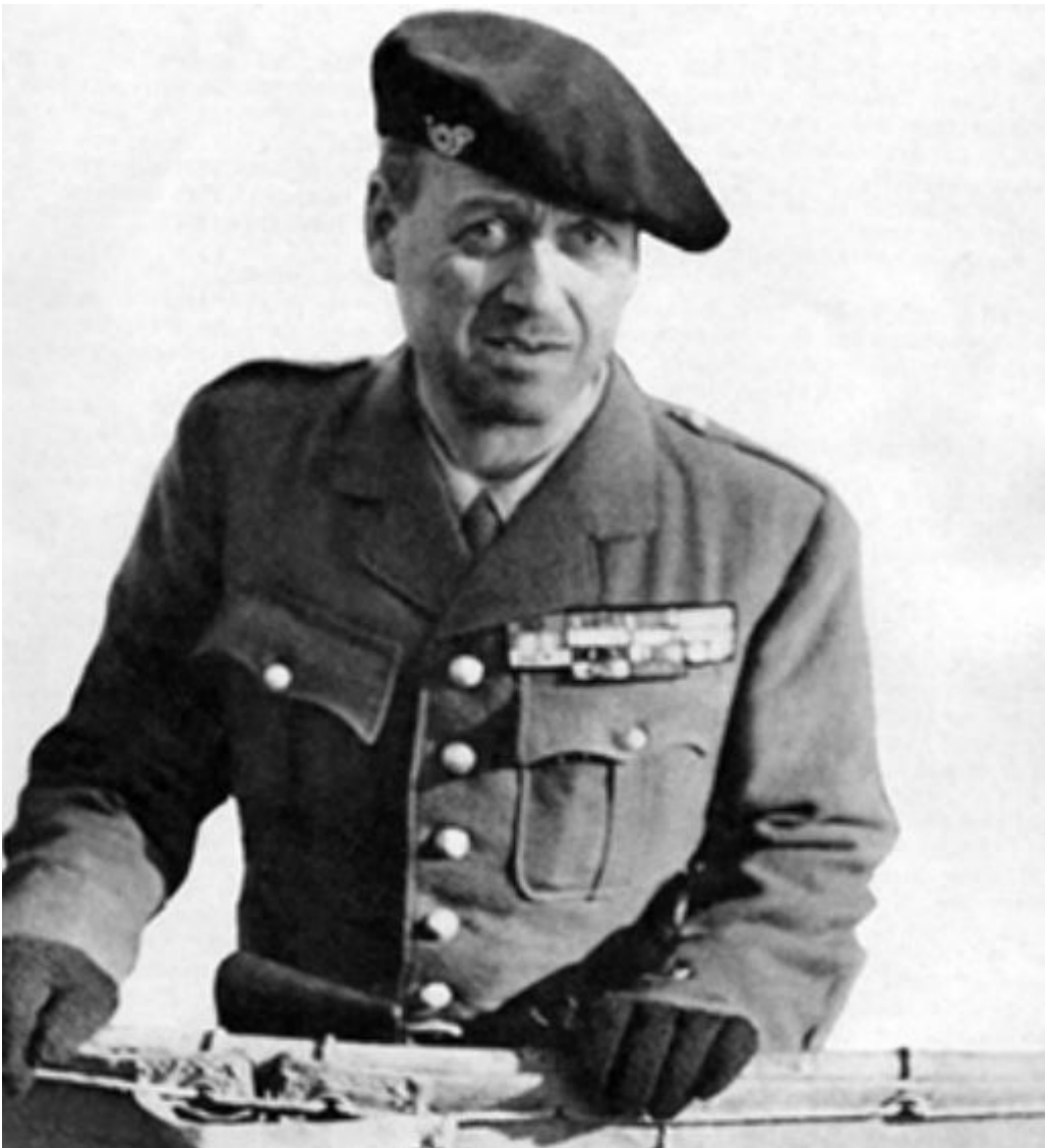
Général BÉTHOUART.

Le 9 avril, les Allemands envahissent le Danemark et débarquent en Norvège sur plusieurs points de la côte. Voilà quel sera le nouveau front du Nord ! La 13 e DBMLE est alors affectée à la division légère du colonel, promu général à titre provisoire, BÉTHOUART, qui comprend déjà deux demi-brigades de chasseurs alpins et une unité de volontaires polonais, commandée par le général BOHUSZ. Direction Brest. Les légionnaires s'embarquent à bord de cinq bâtiments de transport. La musique des équipages de la flotte, qui avait joué la Sidi-Brahim pour les chasseurs, joue le Boudin pour les légionnaires. La grande aventure commence.