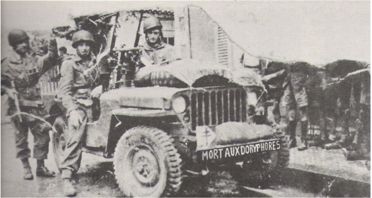
Les Jeep sont partout, crachant le feu...