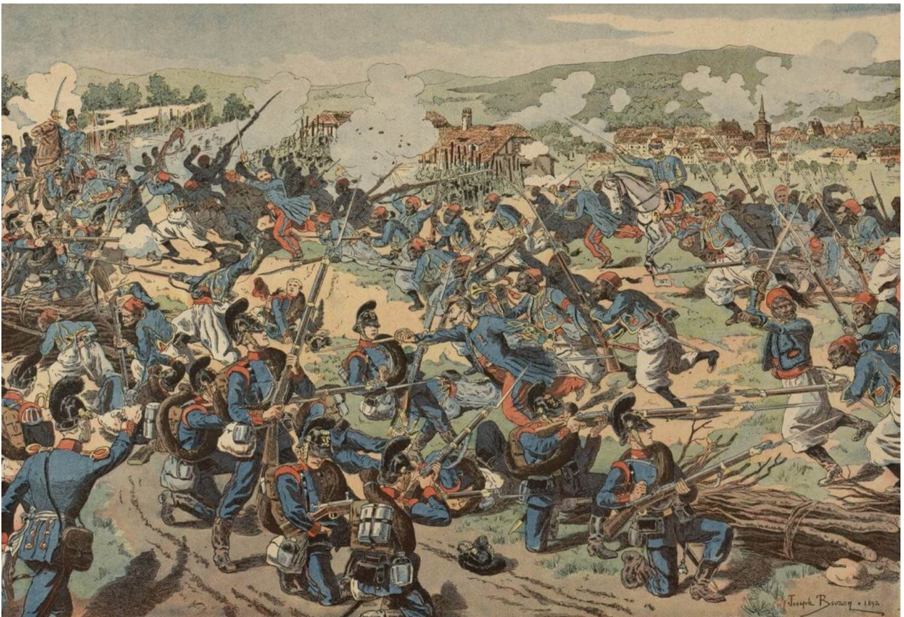
Combat de Wissembourg (4 août 1870). Charge à la baïonnette du 1er turcos contre l'infanterie bavaroise. Illustrateur : Joseph BEUZON, 1892.

Pour achever d'inquiéter le maréchal, un violent orage éclate au cours de la nuit, les soldats fatigués ne peuvent se reposer, et le terrain est détrempé.