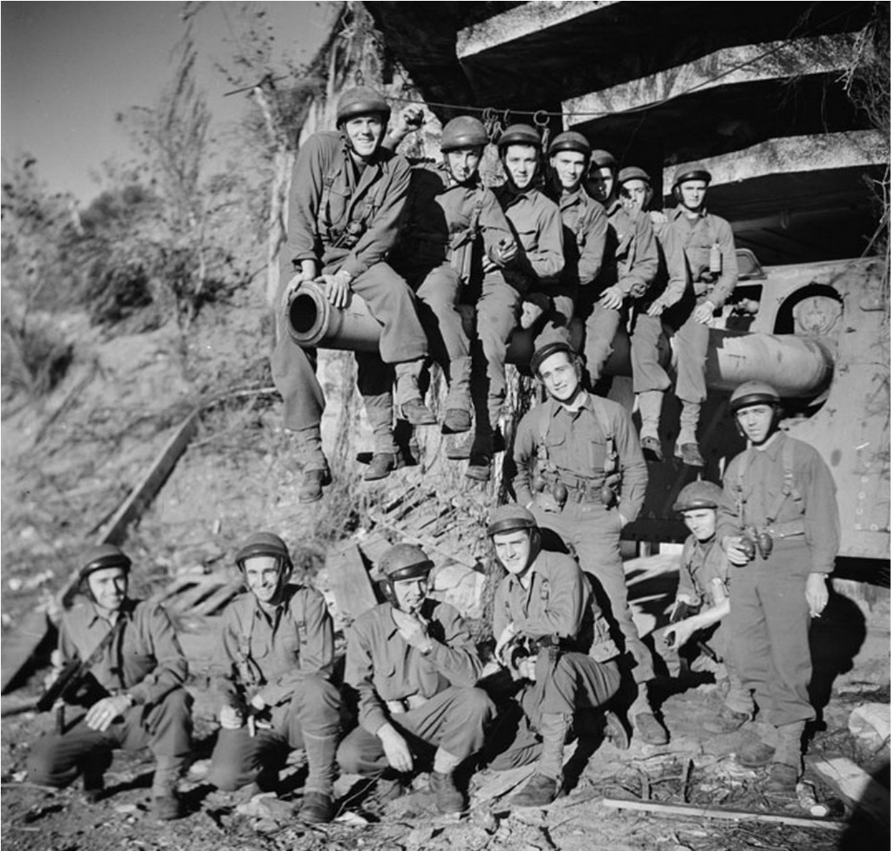
Le groupe des commandos d'Afrique réuni après un exercice d'attaque du fort de Mauvannes, au-dessus d'Hyères (janvier 1945).