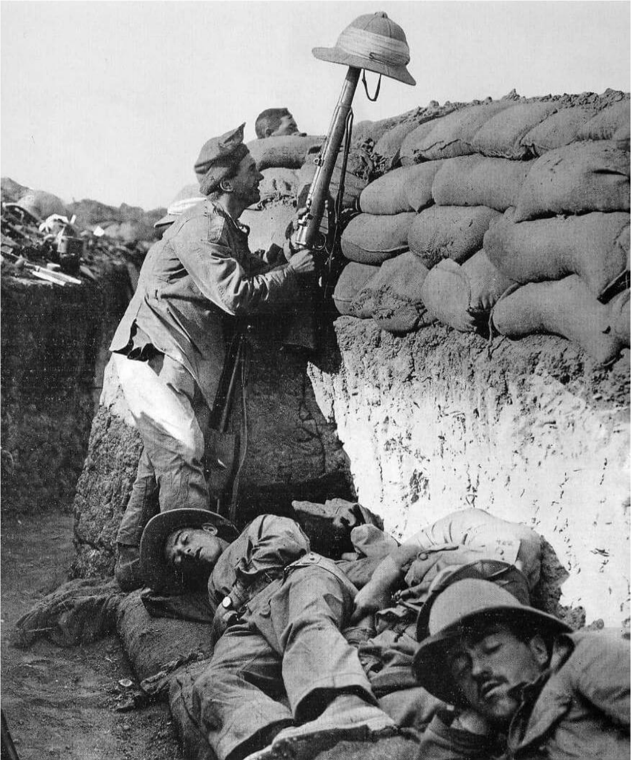
Soldats australiens à Gallipoli.