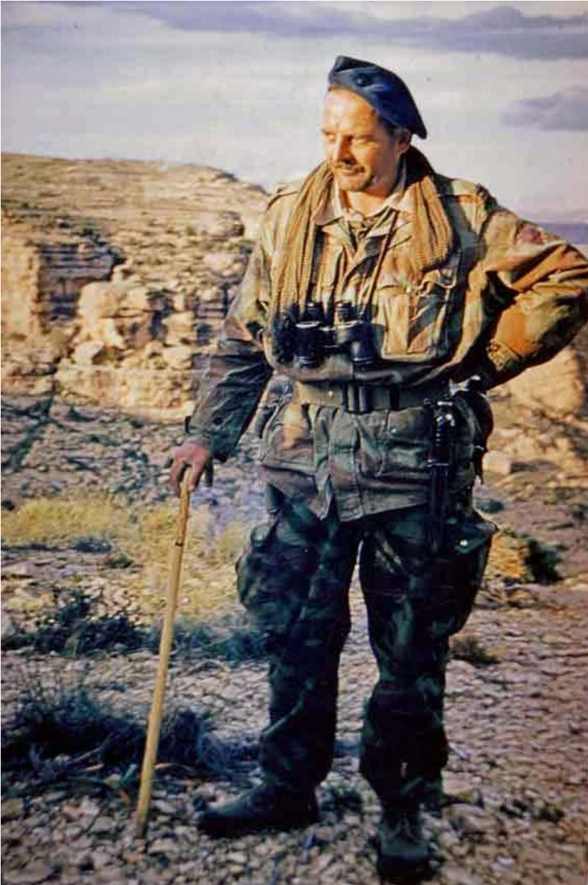
Capitaine Joseph Onimus

Plus au nord, de l'autre côté du col, la 1 re compagnie du capitaine Onimus est prise sous le tir d'une MG 42. Le caporal Margouet, tireur au mortier de 60, est grièvement blessé au ventre. La 1 re section donne l'assaut et s'empare de la mitrailleuse. Au cours de l'action, le sous-lieutenant Rabut est légèrement blessé. Il garde tout de même le commandement de sa section.