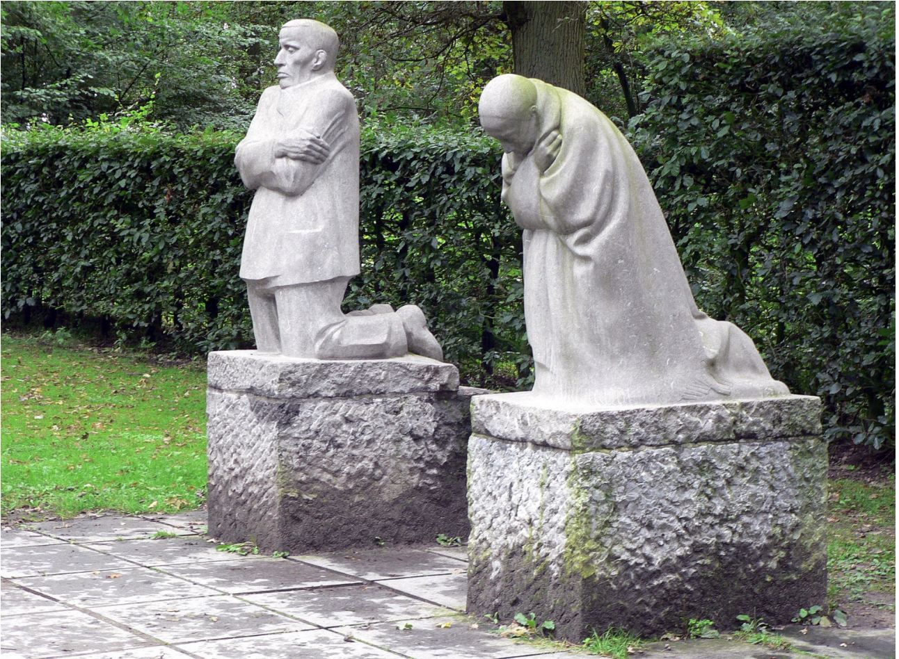
Monument du Kindermord à Dixmude.