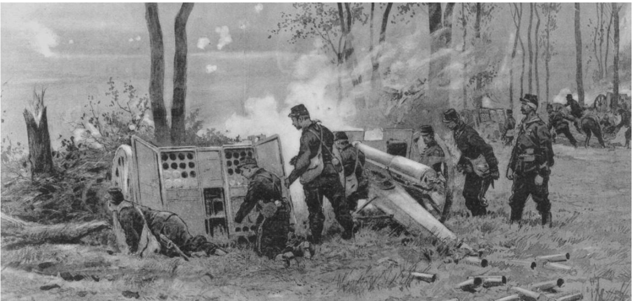
Canon de 75. Illustration de G. Scott.