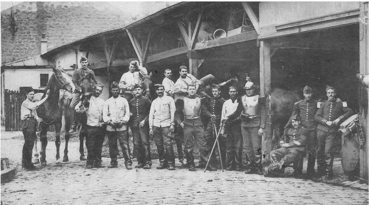
Un cantonnement français en août 1914.

À noter que l'armée française actuelle déplore que certaines règles héritées du passé nuisent à l'entraînement. À titre d'exemple, les exercices de tir sont encore régis par des normes établies dans les années 1960 pour les armes de l'époque et pour des conscrits. Comme le déplore le Chef d'état-major de l'armée de Terre, le général Schill, cela crée un cadre d'entraînement inadapté qui empêche de se préparer à un conflit majeur.