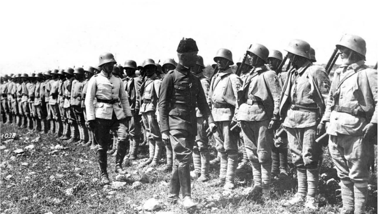
Kress von Kressenstein inspectant des troupes ottomanes.