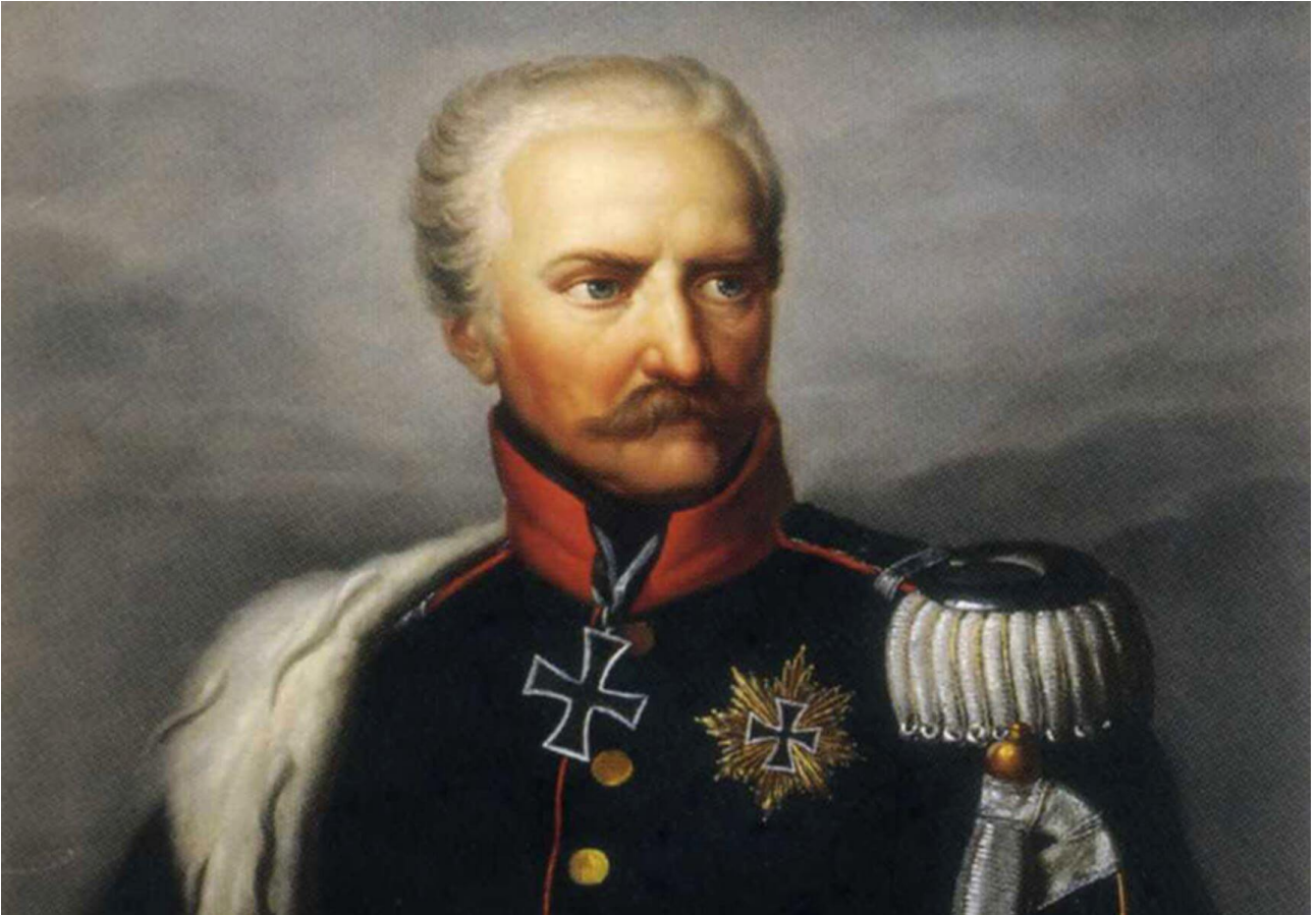
Gebhard Leberecht von Blücher, prince de Wahlstatt.

- Gebhard Leberecht von Blücher (1742-1819) a derrière lui une longue carrière militaire (il a servi sous Frédéric Le Grand). Comme tous les officiers prussiens, la défaite d'Iéna (1806) l'a traumatisé et il en nourrit une profonde francophobie (14) . Il est donc, malgré son âge avancé, de toutes les campagnes contre Napoléon et commande l'armée de Silésie lors de l'invasion de 1814. Contrairement à Schwarzenberg, il prône une tactique résolument offensive (ses subordonnés le surnomment « Marschall Vorwärts », le maréchal en avant). Ces divergences de vues ne seront pas sans générer des incohérences opératives entre les armées alliées, et l'Empereur saura en jouer.