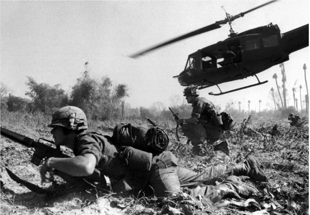
Opérations de combat dans la vallée d'la Drang, Vietnam, novembre 1965. L'hélicoptère UH-1D du Major Bruce P. Crandall remonte vers le ciel après avoir déchargé des fantassins en mission de recherche et de destruction.