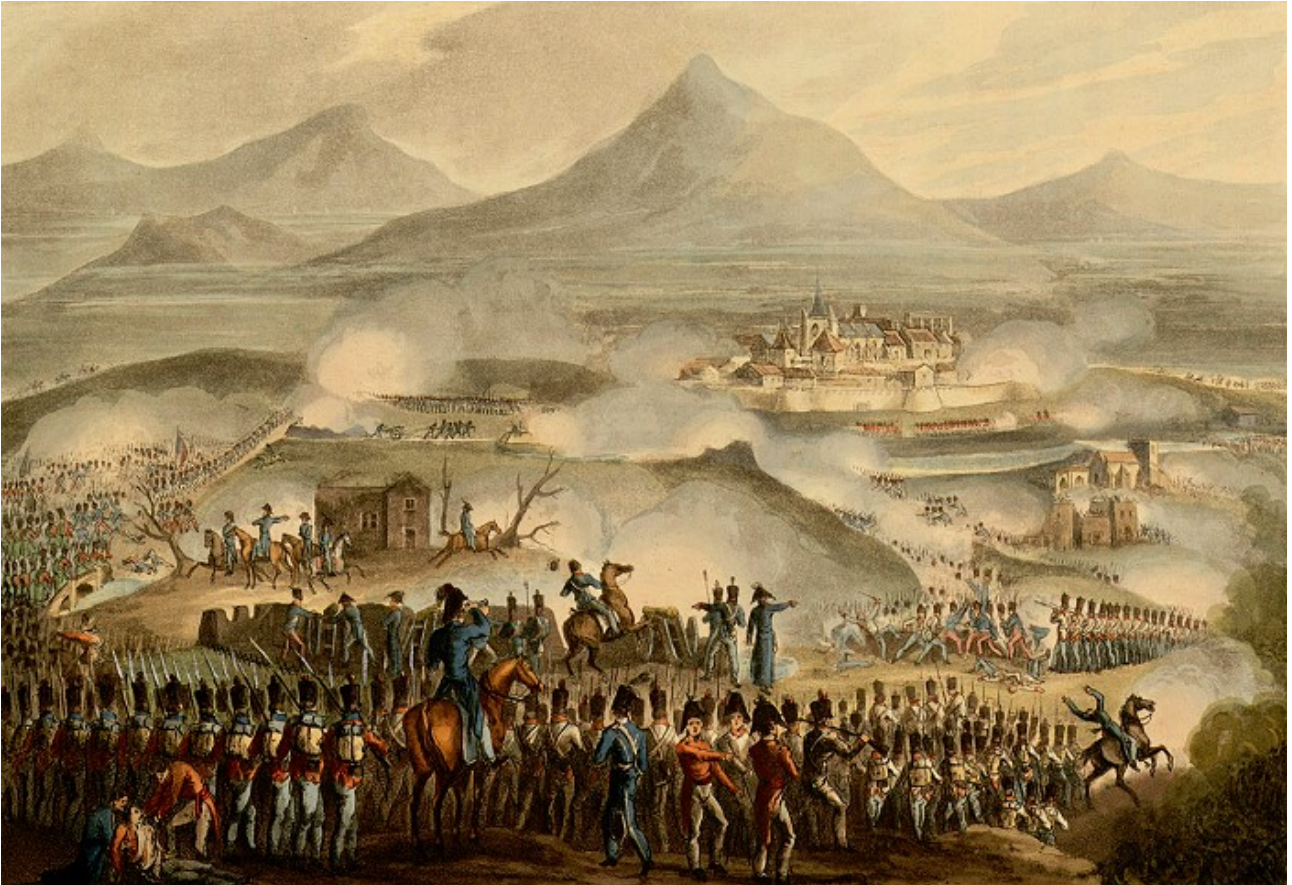
Bataille de Toulouse (1814)

10 avril 1861 : prise de My Tho. (sur le Mékong – ancienne Cochinchine).