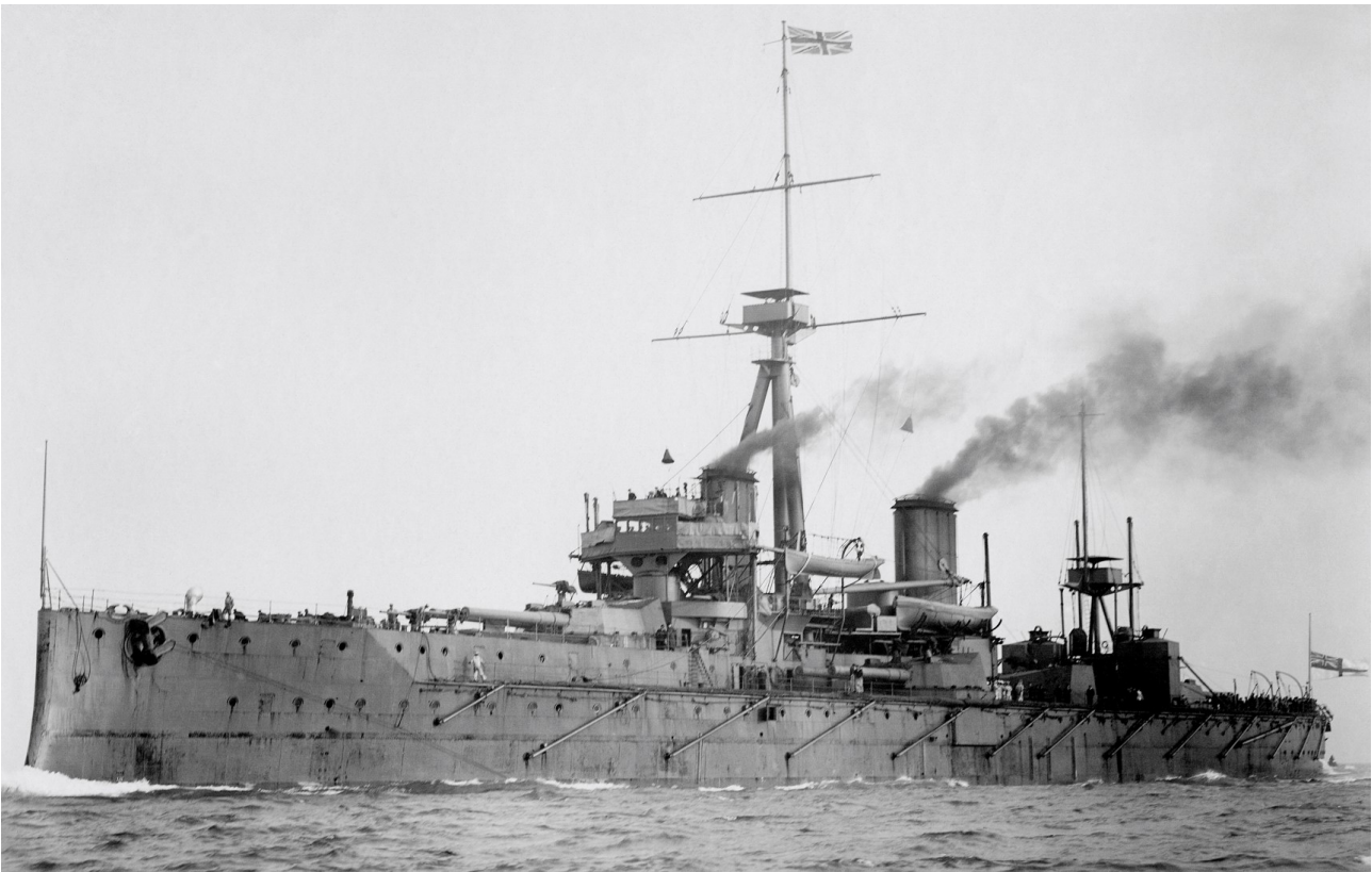
HMS Dreadnought en 1906-1907.

Lire l'article dédié sur Theatrum Belli.