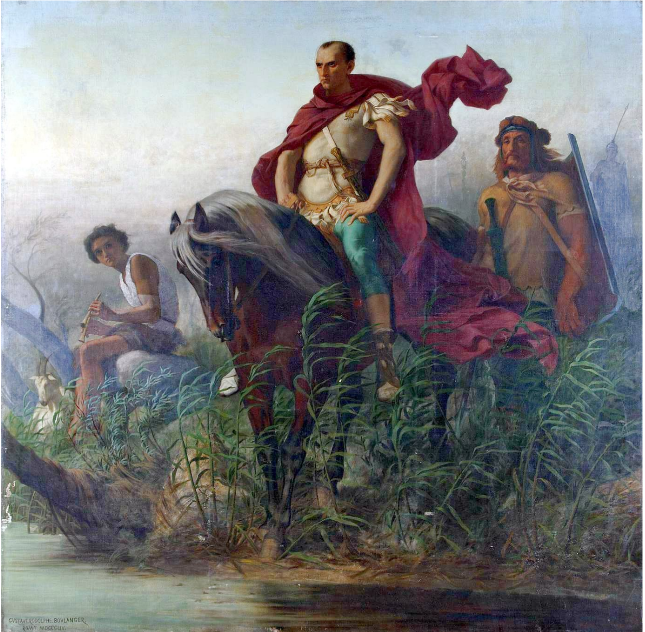
Jules-César arrivé au Rubicon, par Gustave Boulanger (1824-1888).

10 janvier 1430 : création de l'ordre de la Toison d'or (Bruges).