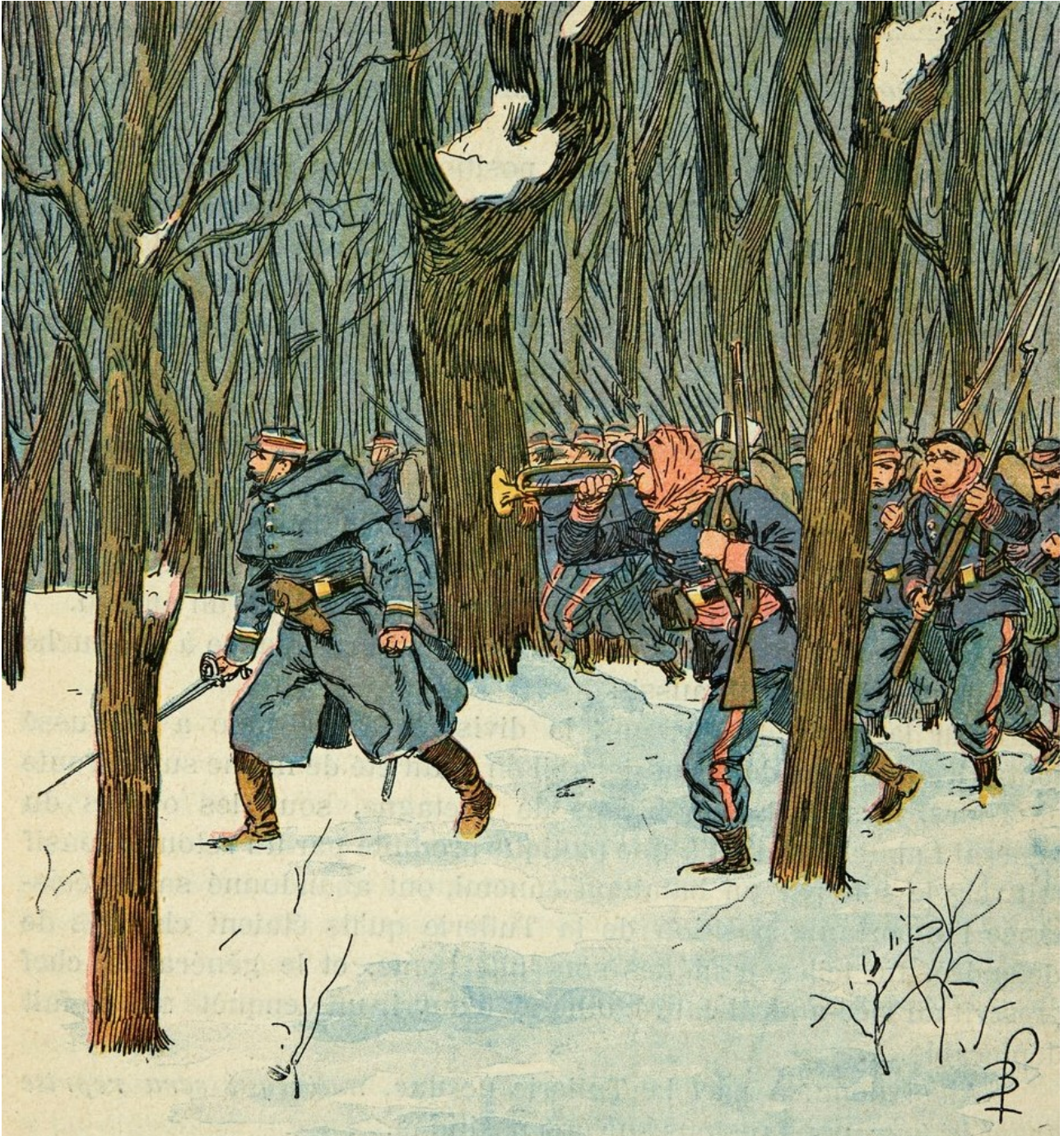
Charge à la baïonnette, sous bois, des mobiles de la Sarthe.

10 janvier 1916 : début de la bataille d'Erzurum pendant la campagne du Caucase de la Première Guerre mondiale.