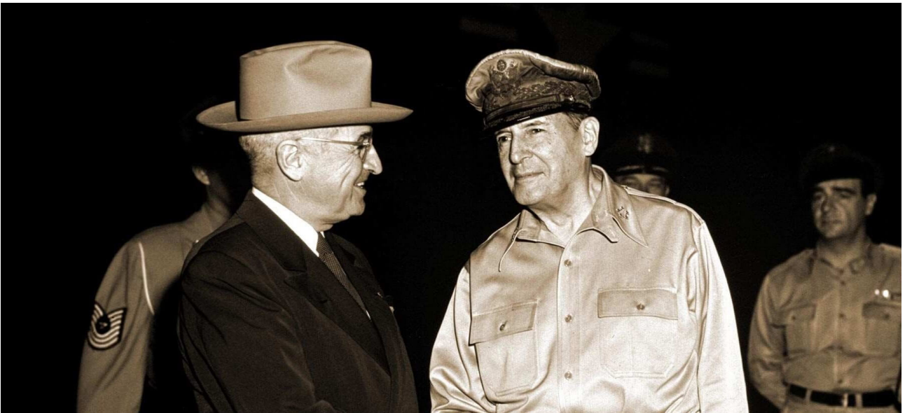
Truman et MacArthur.

Alors que l'impopulaire guerre de Corée se poursuivait, l'administration Truman fut victime d'une série d'affaires de corruption, et le président décida de ne pas se représenter en 1952. Un comité sénatorial présidé par le démocrate Richard Brevard Russell Jr. enquêta sur la suspension de MacArthur. Elle conclut que la « destitution du général MacArthur était en accord avec les pouvoirs constitutionnels du président, mais que les circonstances portèrent un coup à la fierté nationale ».