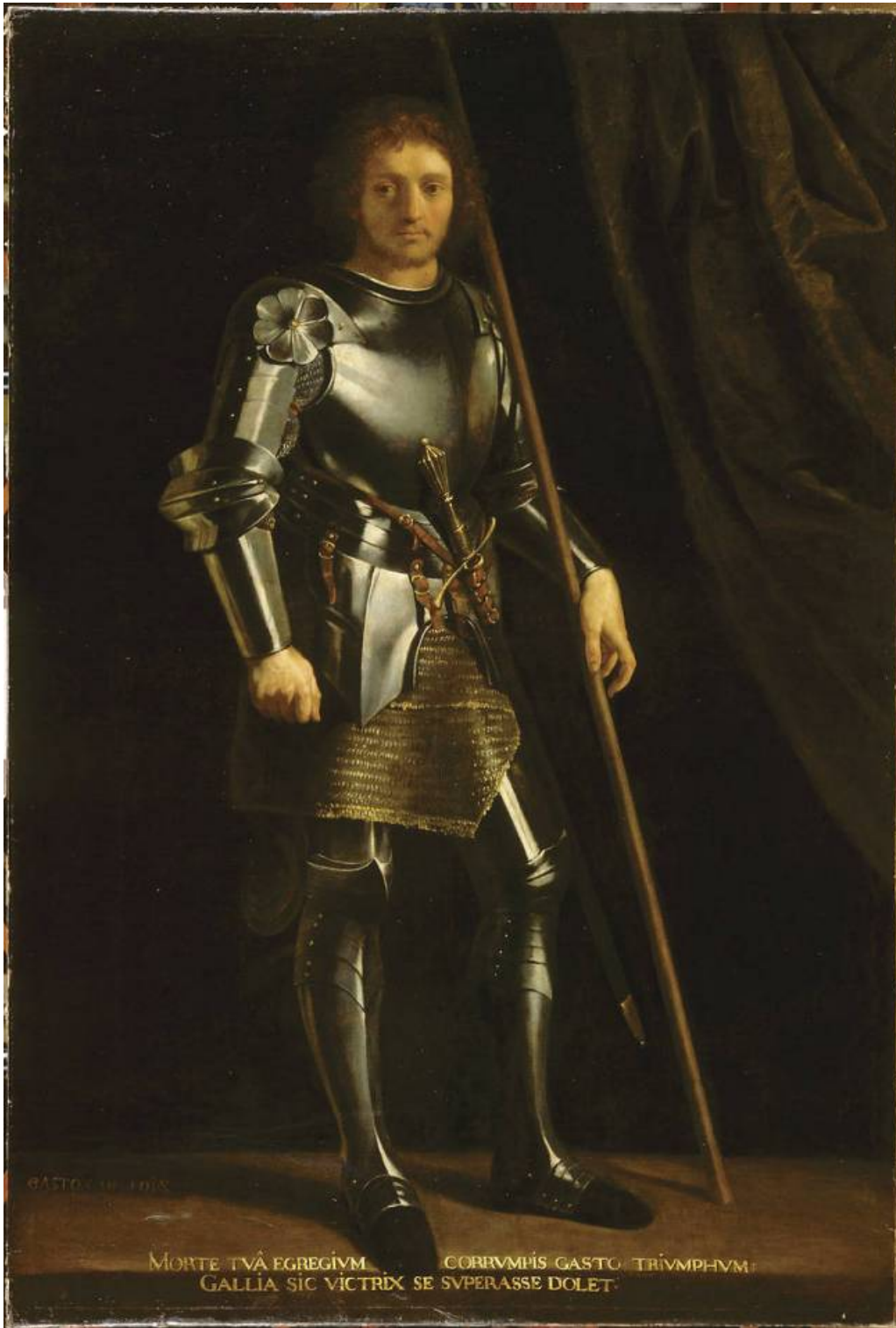
Gaston de Foix

Cette bataille meurtrière fait plus de dix mille morts, dont Gaston de Foix lui-même. Elle est la