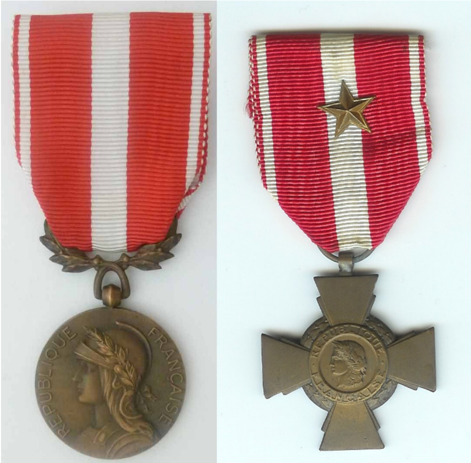
Médaille puis croix de la Valeur militaire.

Le 11 avril 1956, par décret, est créée la Médaille de la Valeur militaire qui fut six mois plus tard transformée en Croix de la Valeur militaire. Par décision du 30 avril 1956, elle peut être décernée pour les opérations en Tunisie, depuis le 1 er janvier 1952, au Maroc depuis le 1 er juin 1953, l'Algérie depuis le 31 octobre 1954. Une nouvelle décision du 13 février 1957, ajouta les opérations en Mauritanie depuis le 10 janvier 1957. De nouveaux textes ont mis fin à l'attribution de la croix de la Valeur Militaire sur ces territoires.