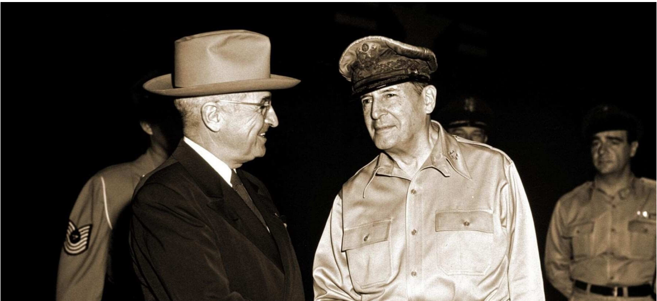
Truman et MacArthur.

Alors que l'impopulaire guerre de Corée se poursuivait, l'administration Truman fut victime d'une série d'affaires de corruption, et le président décida de ne pas se représenter en 1952. Un comité sénatorial présidé par le démocrate Richard Brevard Russell Jr. enquêta sur la suspension de MacArthur. Elle conclut que la « destitution du général MacArthur était en accord avec les pouvoirs constitutionnels du président, mais que les circonstances portèrent un coup à la fierté nationale ».