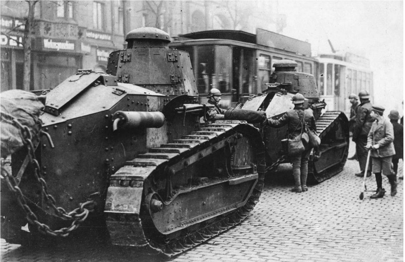
Chars Renault FT dans les rue d'Essen.