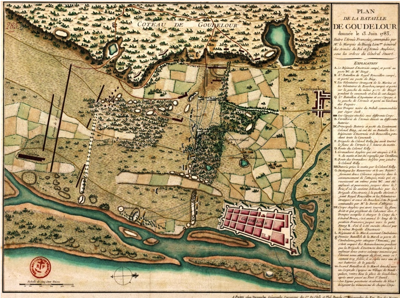
Carte de la bataille terrestre de Gondelour, le 13 juin 1783.