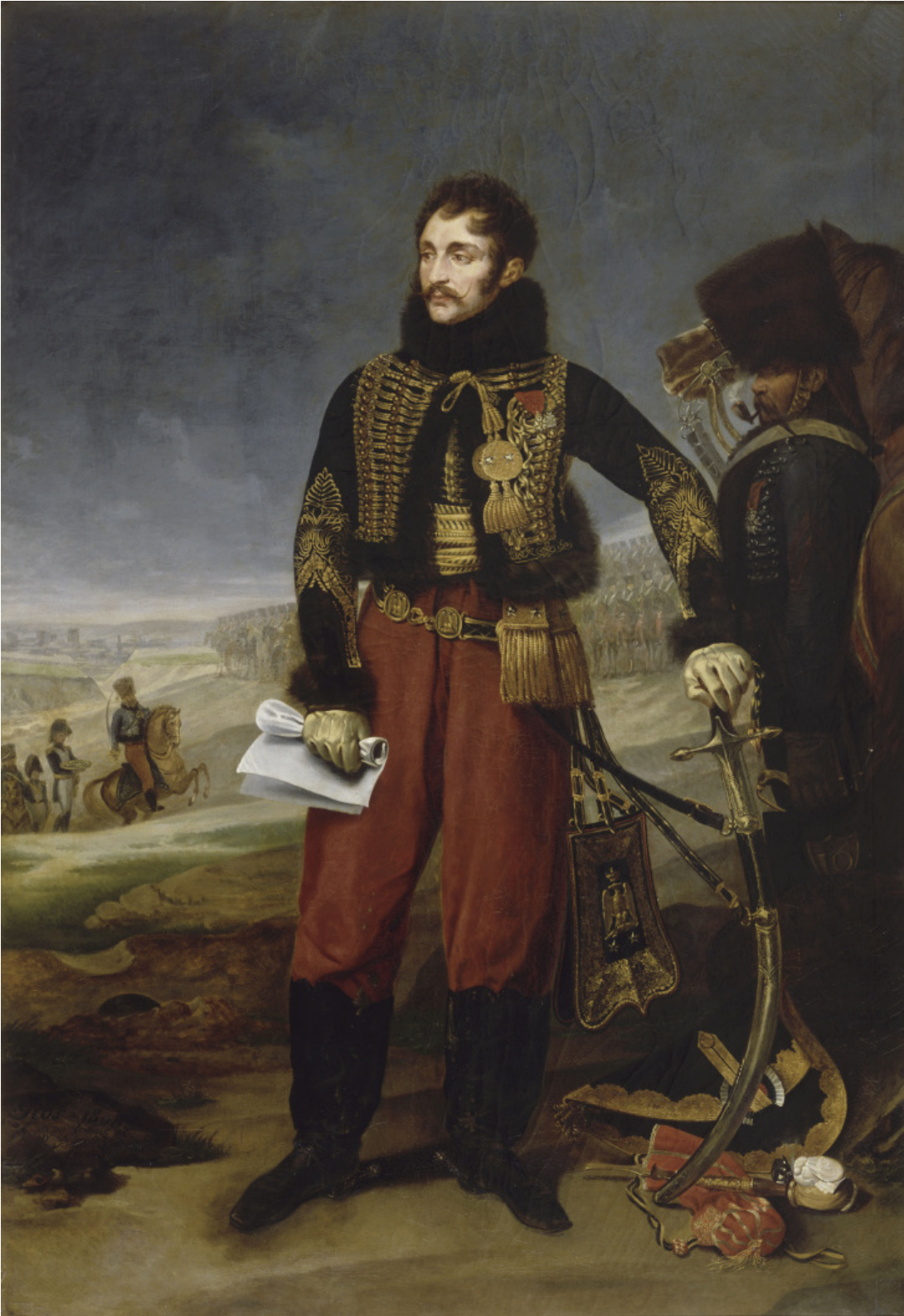
Général de division Antoine Charles Louis de Lasalle.