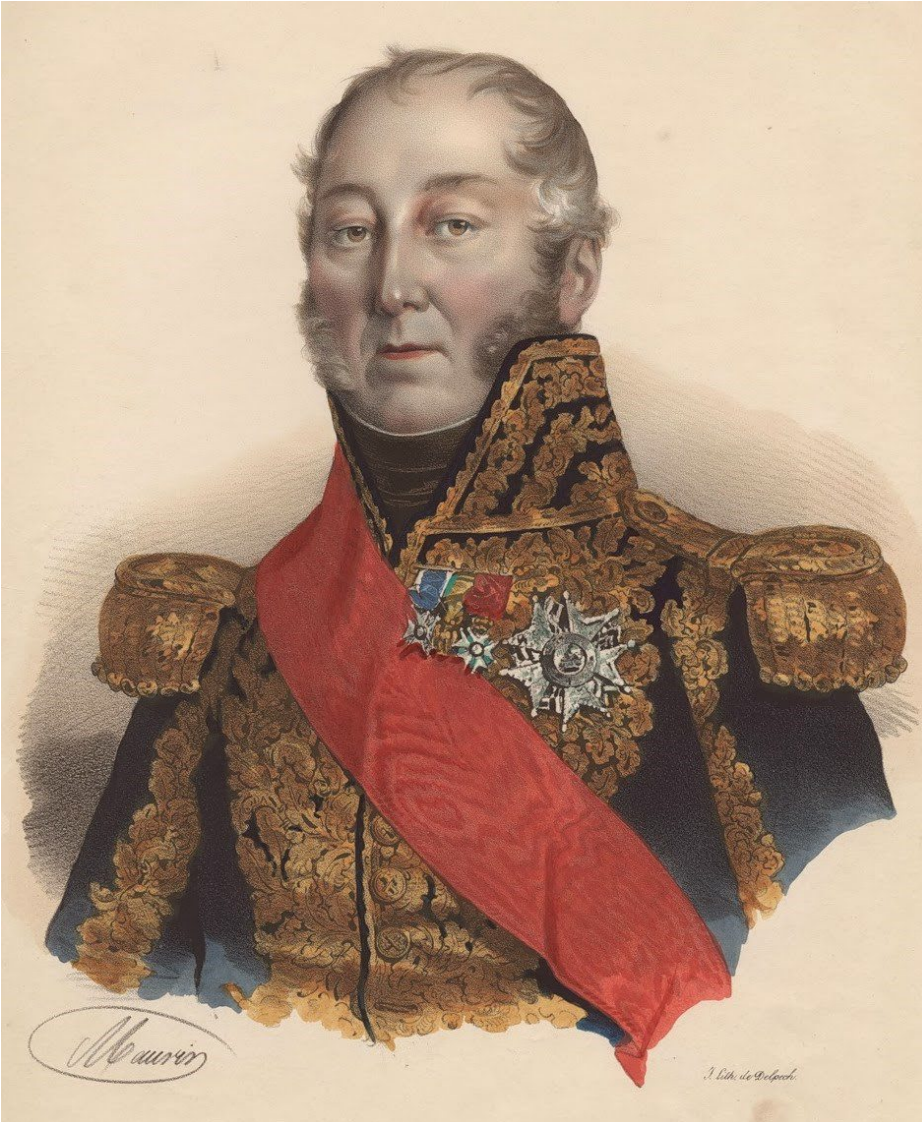
Adolphe Édouard Casimir

Joseph Mortier , duc de Trévise, né au Cateau-Cambrésis le 13 février 1768 et mort à Paris le 28 juillet 1835, est un militaire et homme d'État français, élevé à la dignité de maréchal d'Empire en 1804. Entré dans la carrière militaire en 1791, il participe aux guerres de la Révolution sur le front ouest et est successivement élevé aux grades de général de brigade puis de général de division en 1799. Choisi par Napoléon pour conquérir le Hanovre en 1803, il s'acquitte de sa mission avec succès et est fait maréchal d'Empire. Lors de la campagne de 1805, il reçoit le commandement d'un corps d'armée et livre une furieuse bataille contre les Austro-Russes à Dürenstein. Il prend part aux opérations ultérieures en Prusse et en Pologne et joue un rôle important au cours de la bataille de Friedland en 1807.