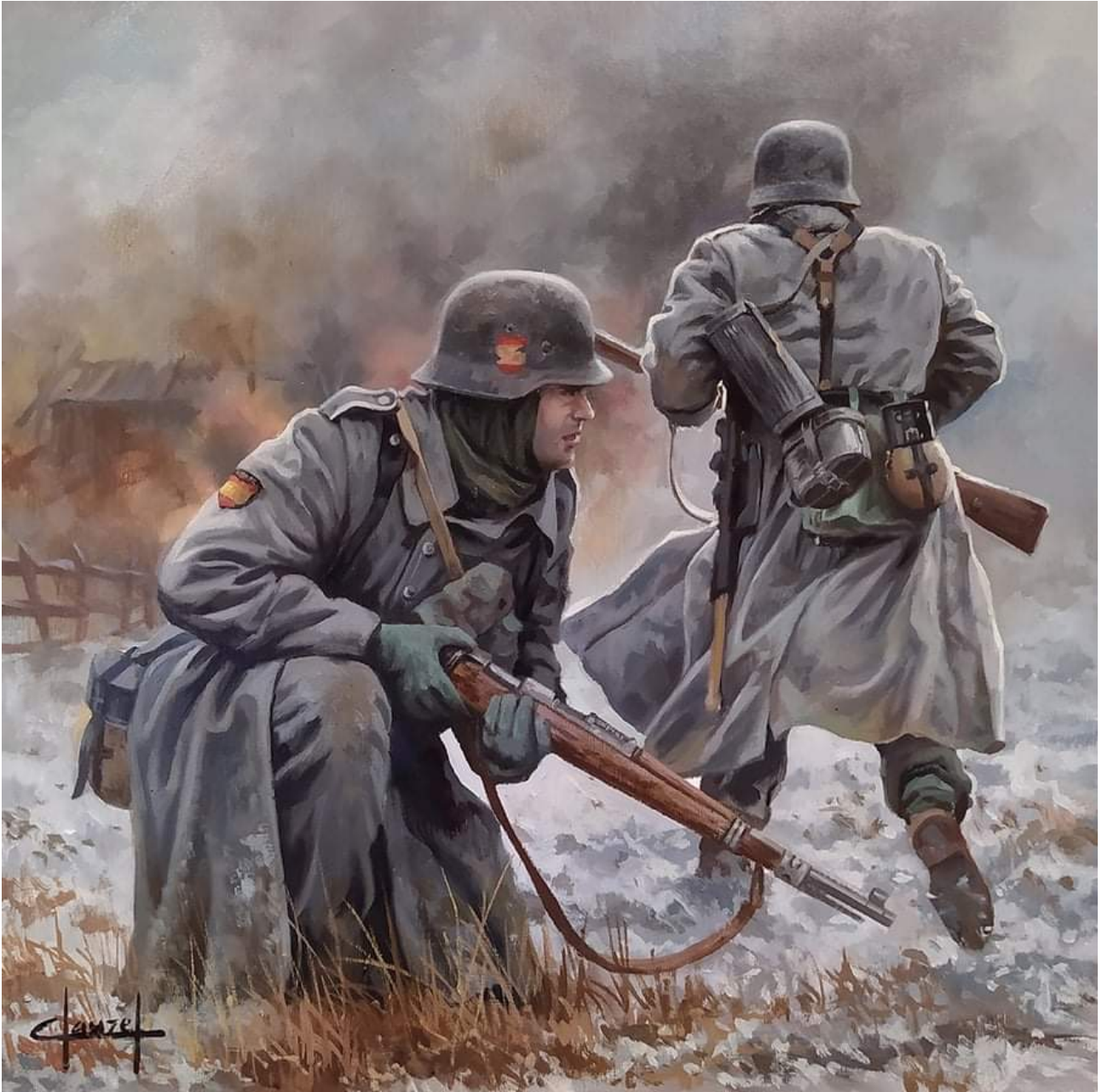
Soldats espagnols de la Division Azul. Illustration de Jose Ferre Clauzel.