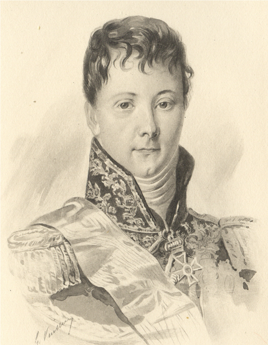
Général Charles-Etienne Gudin

César Charles Étienne Gudin de la Sablonnière , comte de l'Empire, né le 13 février 1768 à Montargis dans le Loiret et mort le 22 août 1812 à Smolensk, est un général français de la Révolution et de l'Empire. Condisciple de Napoléon Bonaparte à l'école de Brienne, il fait carrière dans l'armée de l'Ancien Régime puis de la Révolution. Il devient général de division en 1800 et obtient sous le Premier Empire le commandement d'une division sous les ordres du maréchal Davout. Il se distingue aux batailles d'Auerstaedt, d'Eylau, d'Eckmühl et de Wagram où il fait preuve de talents de tacticien. Le général Gudin est mortellement blessé par un boulet de canon à la bataille de Valoutina Gora pendant la campagne de Russie, le 19 août 1812.