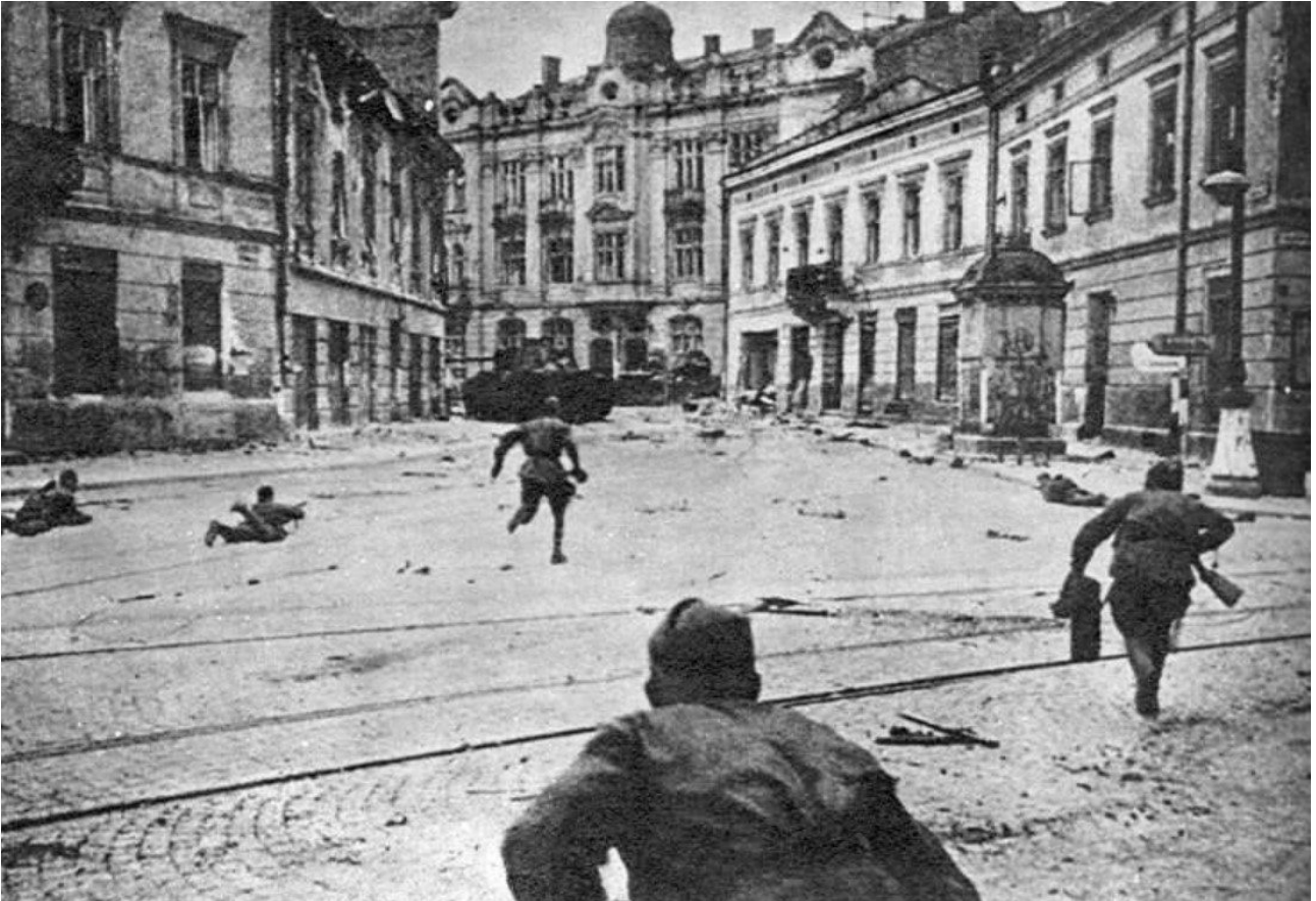
Soldats soviétiques progressant dans Lvov.