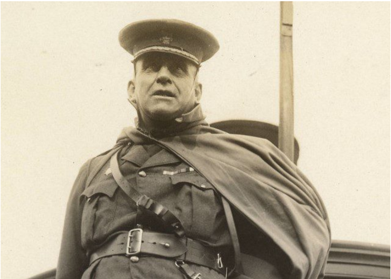
Sam Hugues (1853-1921).