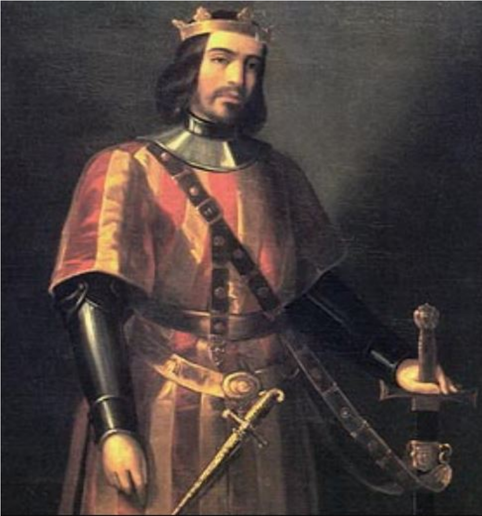
Ferdinand 1er d'Aragon (1380-1416).

Au cours de la période musulmane, la ville a connu les dominations successives des Omeyyades de Damas, des Omeyyades de Cordoue, des Hammudites, des Almoravides, des Almohades puis des Nasrides de Grenade. Medina Antaquira, qui à l'époque avait une population d'environ 2 600 habitants, est devenue une importante ville-frontière du Nord du sultanat Nasride de Grenade. Pour se défendre contre les troupes espagnoles catholiques, des fortifications et un château (l'Alcazaba) ont été construits. Aujourd'hui, seules quelques parties des murs et des tours peuvent être observées, dont la tour appelée Torre del Homenaje.