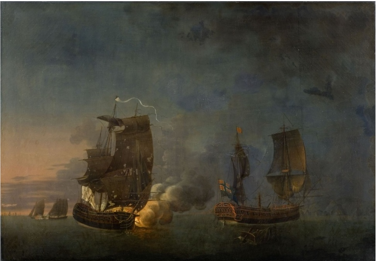
La Belle Poule VS frégate britannique HMS Arethusa.

Cet affrontement pousse Louis XVI à déclarer la guerre à l'Angleterre dans le cadre de ce que l'on va appeler la guerre d'indépendance américaine. 4 navires de guerre ont porté, à ce jour, le nom de belle poule , dont l'actuelle goélette (navire école de la Marine nationale) qui fut un navire de la France libre.