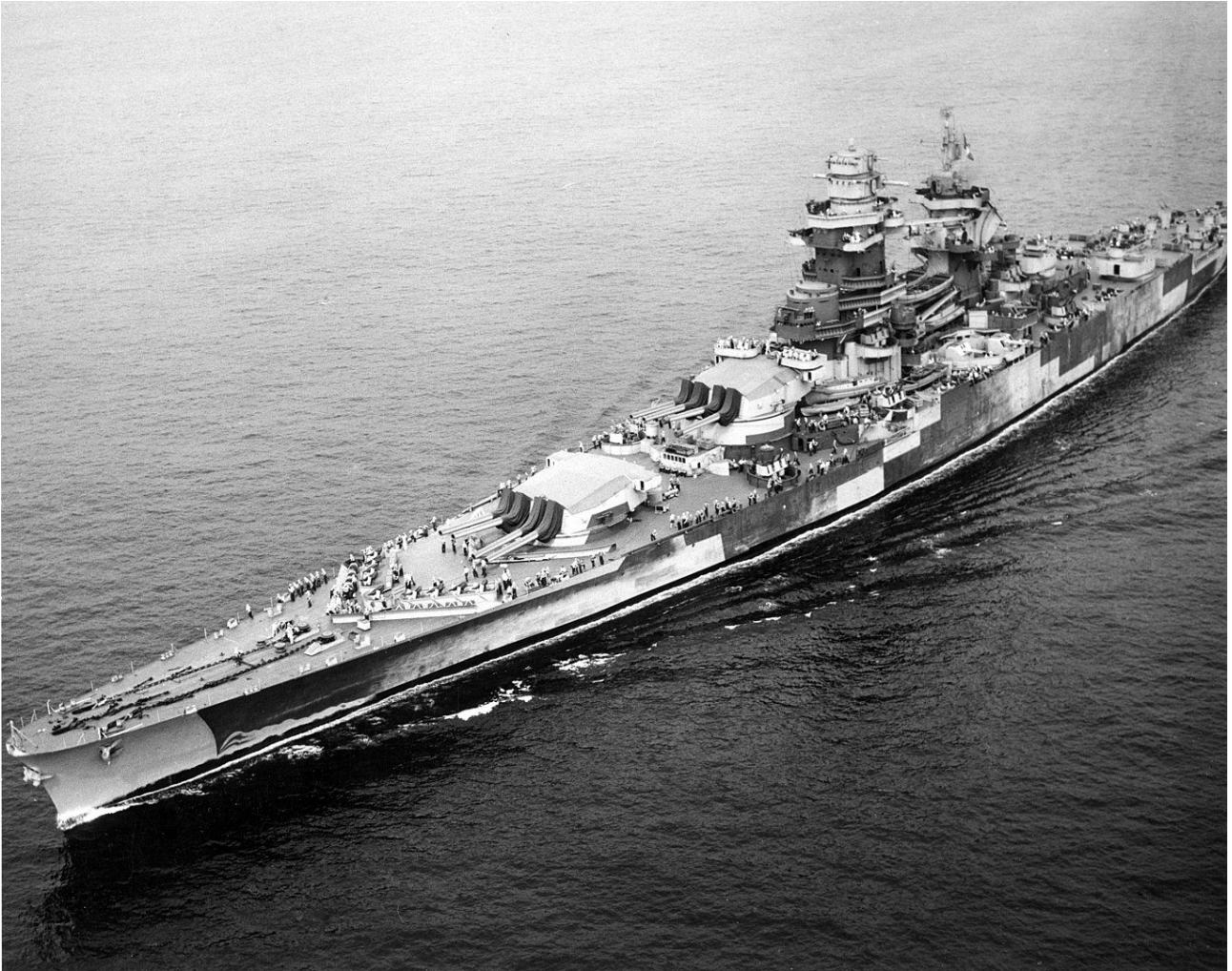
Le Richelieu, à l'automne 1943, après sa refonte aux États-Unis.