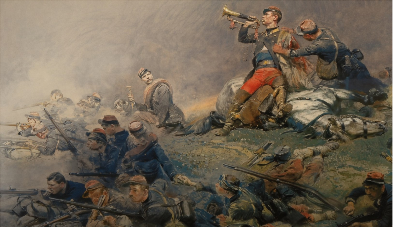
Clairon à Malakoff (1855).