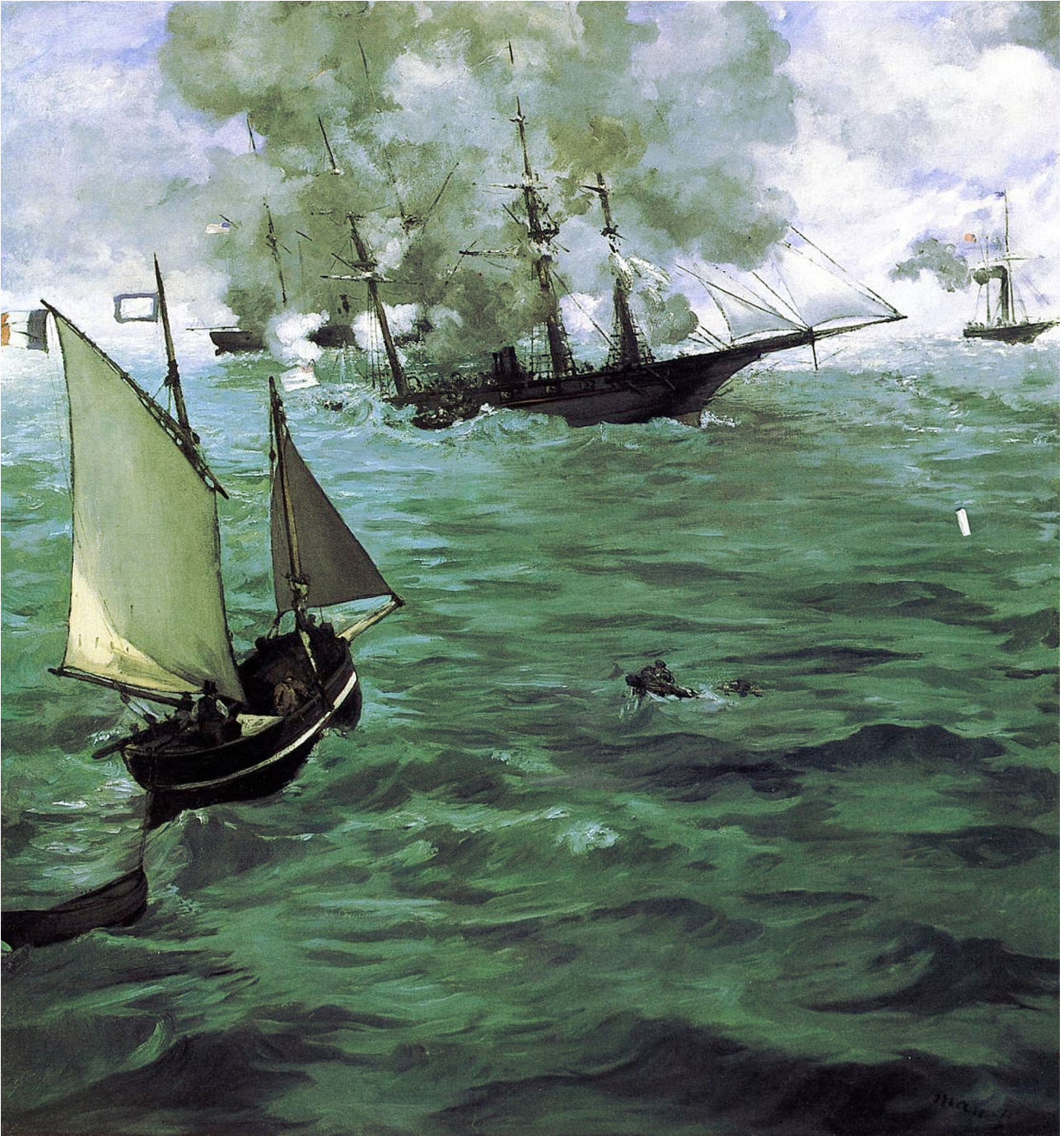
Tableau d'Édouard Manet (1865).