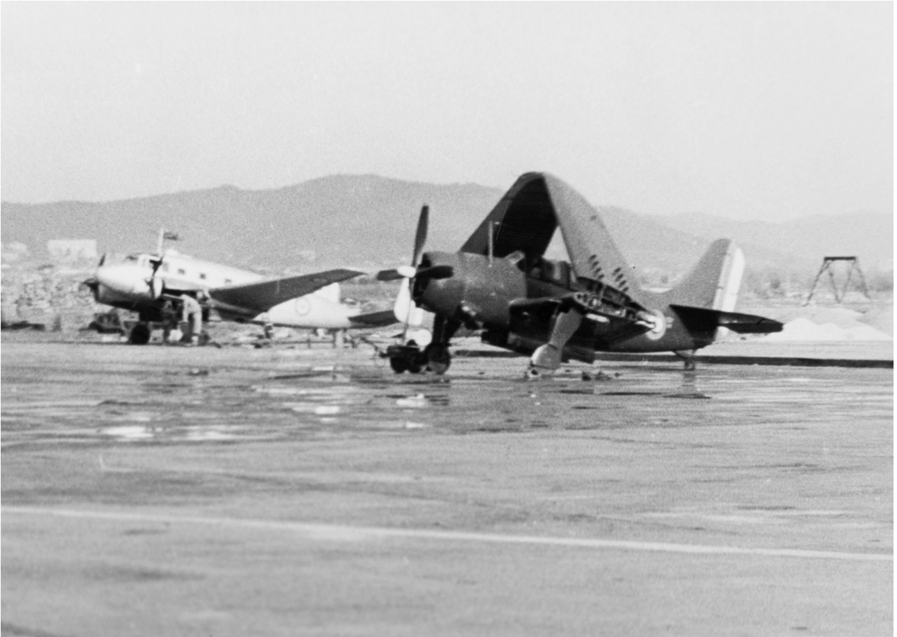
Un Curtiss SB2C Helldiver devant un NC.702 Martinet en 1951 sur la base.

Aéronefs sur la base aéronavale de Hyères dans les années 1970.