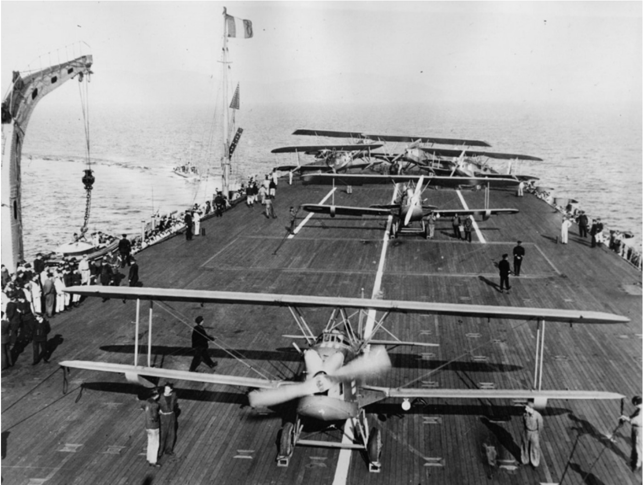
Biplans sur le pont du Béarn en 1932.

En avril 1932, le Levasseur PL.10 remplace le PL.4 dans la 7S1. Le 3 avril, le porte-avions reçoit la visite de François Piétri, ministre de la Défense nationale. À ce moment-là, la 7C1 faisait modifier ses nouveaux Wibault 74 et ne pouvait pas participer à la croisière de l'escadre en Méditerranée orientale du 15 avril au 25 juin. Les PL.10 font leurs premiers appontages le 20 juillet. Le bâtiment est transféré à la 1 re escadre de ligne en octobre. Le mois suivant, une inspection critique l'état de préparation au combat du Béarn car limité alors à une vitesse de 15 nœuds. En 1933, l'effectif de chaque escadrille passe de six à neuf appareils, à l'exception de l'escadrille de chasse qui passe à dix. Lors de la croisière de la 1 re escadre en Afrique du Nord, du 3 mai au 24 juin, les escadrilles du Béarn s'entraînent à la recherche et à l'attaque des navires ennemis depuis une base terrestre et, quelques jours plus tard à la mi-mai, utilisent Oran (Algérie), pour pratiquer le tir sur cible. Quelques mois plus tard, les PL.10 de la 7B1 s'entraînent à attaquer des cuirassés escortés par des destroyers le 20 juillet. Quelques semaines plus tard, le 5 août, le porte-avions participe à une revue navale passée par Pierre Cot, ministre de l'Air. Le Béarn est mis hors service d'août à novembre, période pendant laquelle la 7S1 passe du PL.10 au PL.101, une version améliorée du même avion.