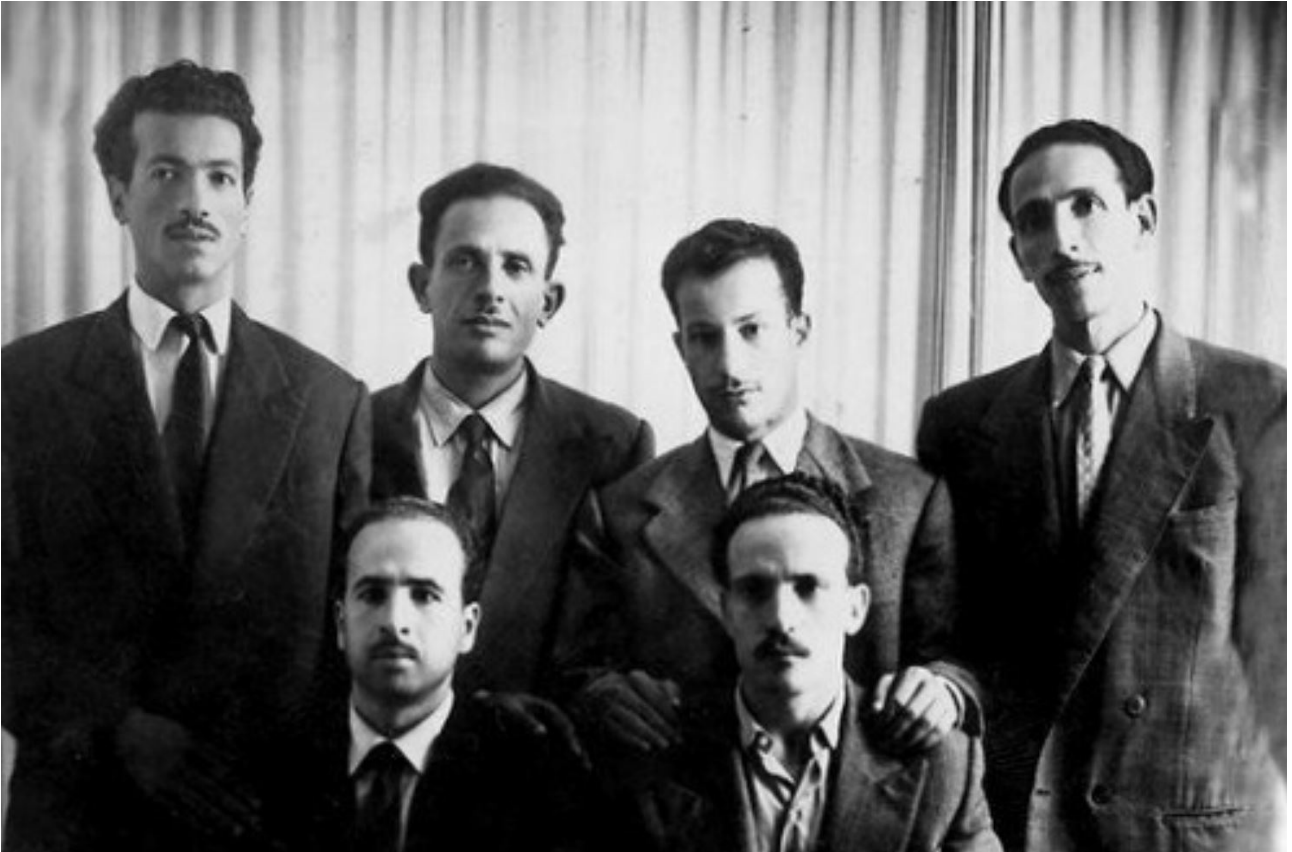
Debout, de gauche à droite : Rabah Bitat, Mostefa Ben Boulaïd, Didouche Mourad et Mohammed Boudiaf. Assis : Krim Belkacem à gauche, et Larbi Ben M'Hidi à droite.

1 er novembre 1979 : mort à 85 ans d'Albert Préjean.