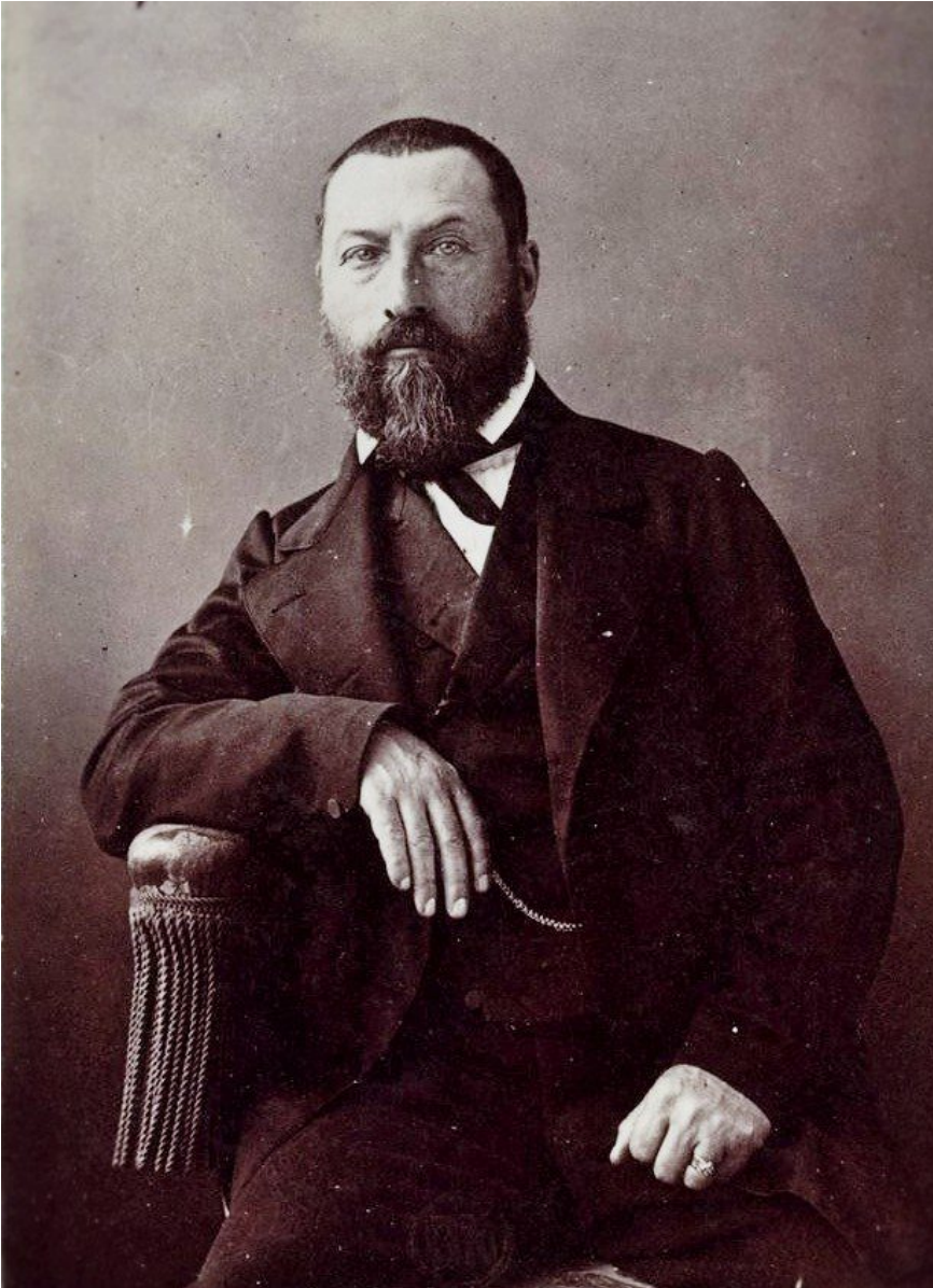
Jean Macé (1815-1894)

En 1888, Jean Macé, sénateur, et trente-six de ses collègues, déposent un projet de loi tendant à l'institution dans tous les chefs-lieux de canton d'exercices mensuels pour les jeunes gens.