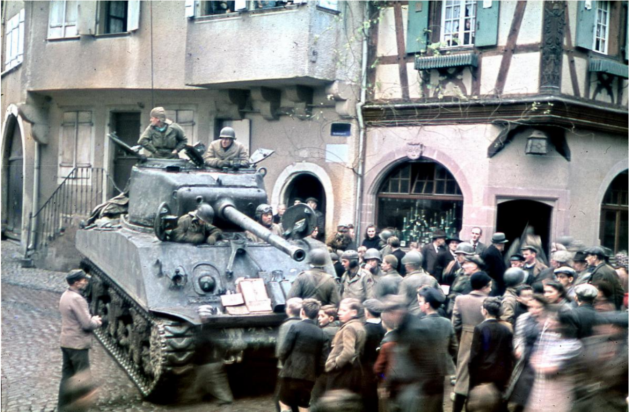
Bataille de la poche de Colmar : Un char Sherman M4 lors de la libération de Riquewihr, dans le Haut-Rhin.

20 janvier 1951 : fin de la bataille de Vinh Yen (Indochine). Et victoire de de Lattre.