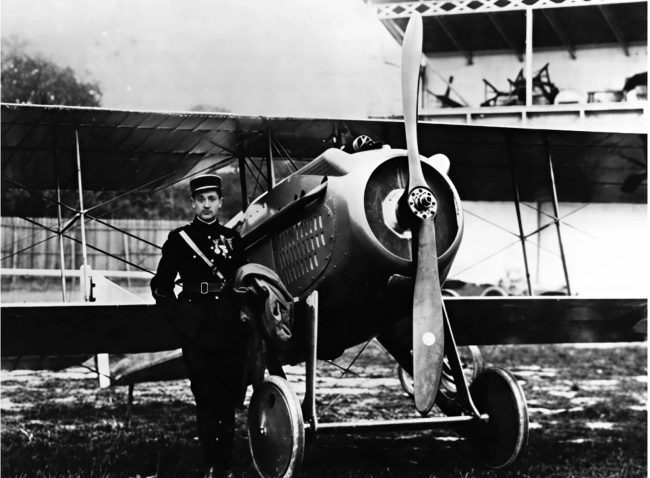
L'hélice ECLAIR montée sur le SPAD de Guynemer.