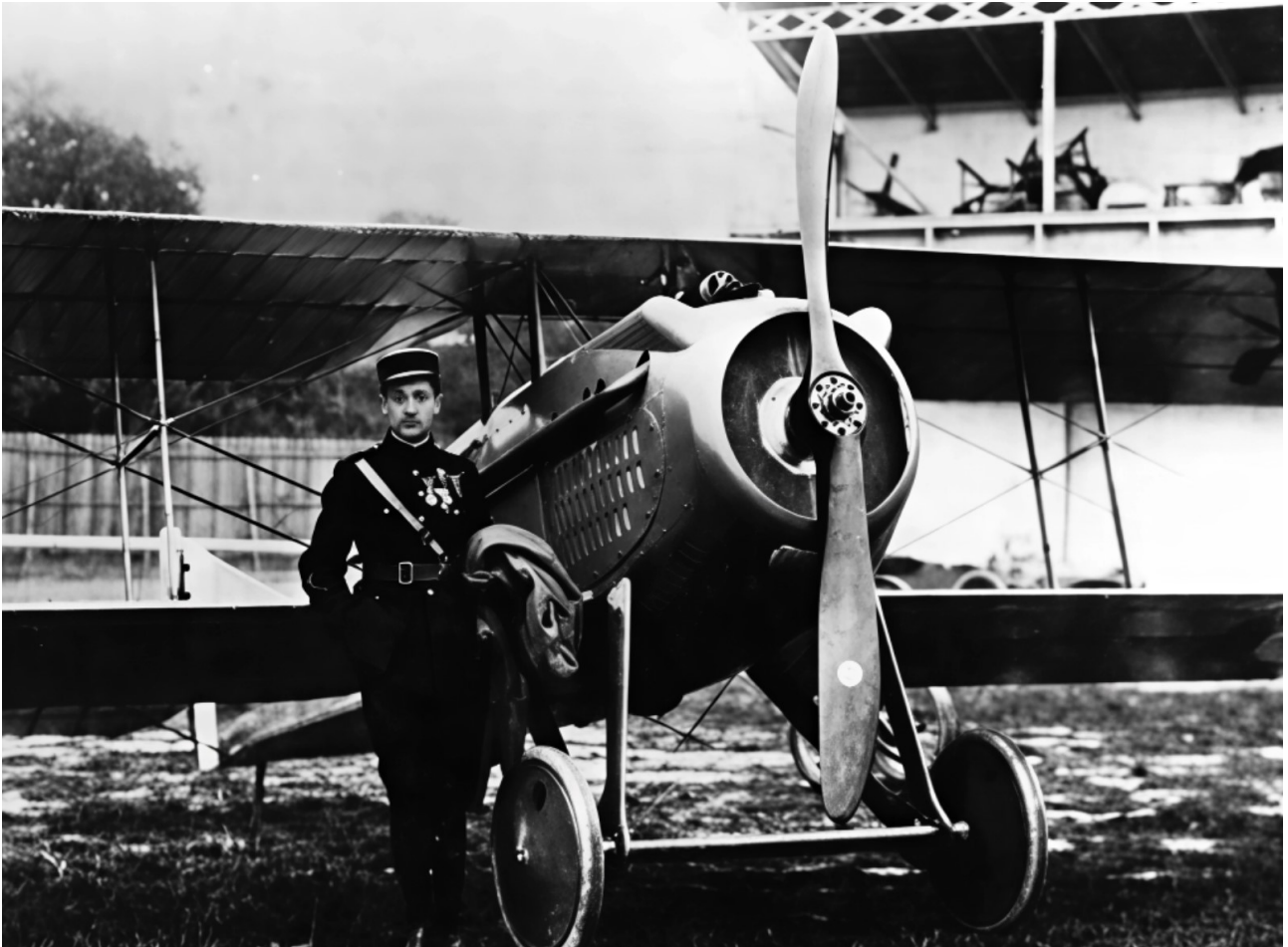
L'hélice ECLAIR montée sur le SPAD de Guynemer.