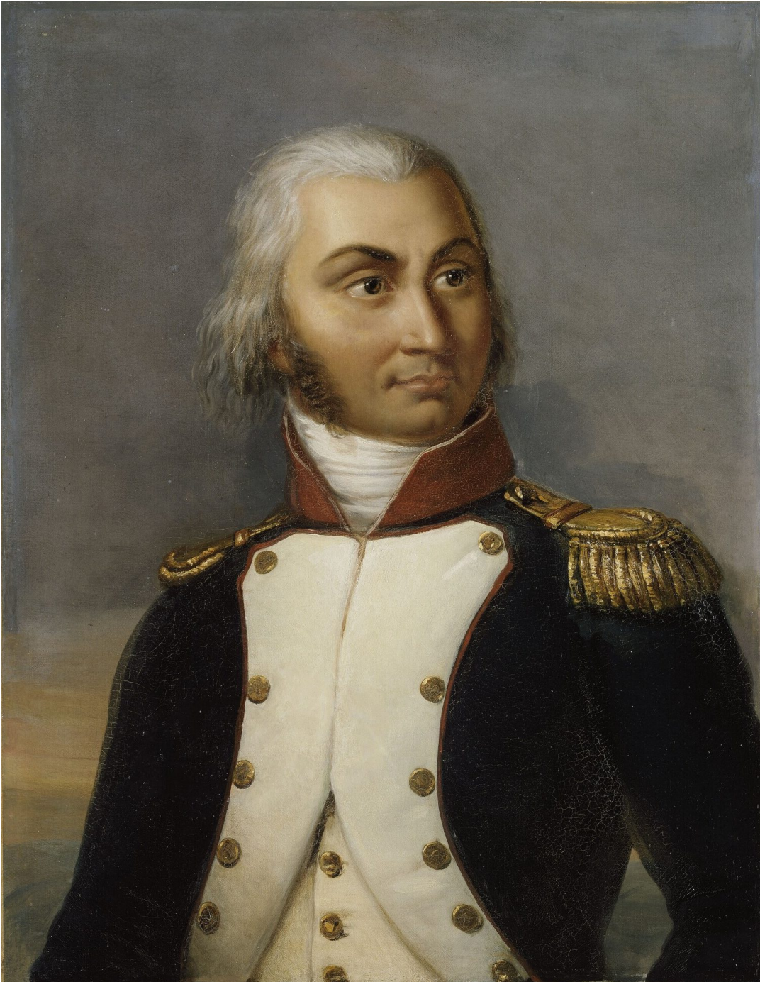
Jean-Baptiste Jourdan, lieutenant-colonel au 2e bataillon de la Haute-Vienne en 1792.

Favorisé par son républicanisme affiché, Jourdan devient un brillant général de la Révolution : il est vainqueur à Wattignies et surtout à la bataille de Fleurus, le 26 juin 1794, événement qui sauve la France d'une invasion et qui lui vaut une popularité immédiate. La même année, il remporte encore les batailles de Sprimont et d'Aldenhoven qui permettent le rattachement de