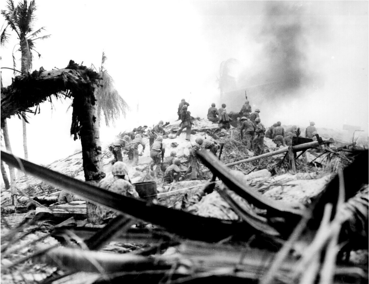
Marines storm Tarawa. Gilbert Islands, November 1943

23 novembre 1944 : Phalsbourg est prise par la 7e armée américaine.