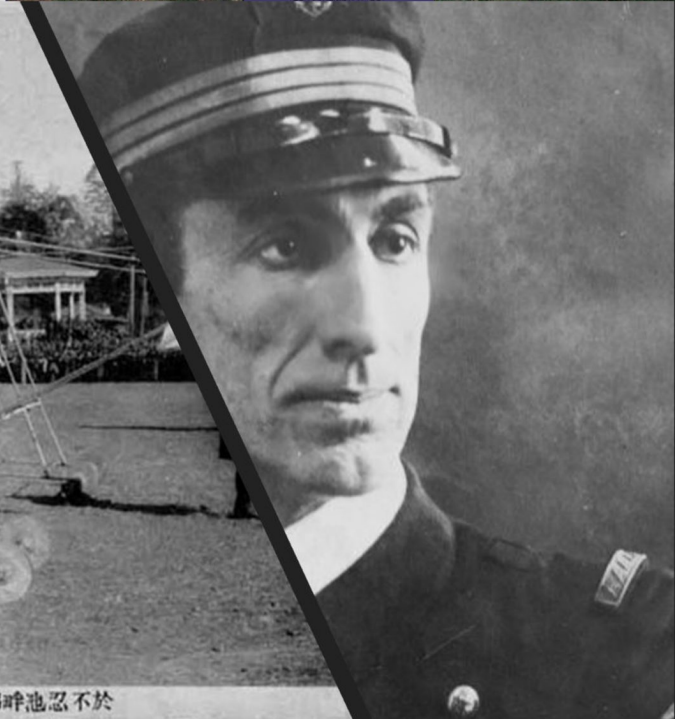
景光ノ揚飛機行飛中空氏レーアツブル尉中軍海國佛時池忍不於