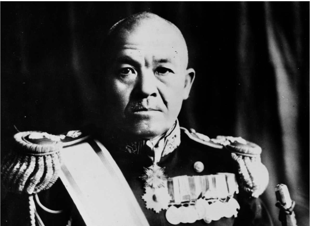
Imperial Japanese Navy Portrait photograph, taken circa 1941-42, when he was commander of the First Air Fleet. Original photograph was in the files of Rear Admiral Samuel Eliot Morison, USNR. U.S. Naval History and Heritage Command Photograph.

Toujours à la tête de la plus puissante escadre de porte-avions japonais, redésignée comme la 3 e Flotte, il n'a plus connu que des résultats mitigés, aux batailles des Salomon orientales (24-25 août 1942) et des îles Santa Cruz (24-27 octobre 1942). Il n'a plus eu de commandement à la mer après novembre 1942. En juillet 1944, il se suicide pour ne pas être fait prisonnier lors de l'attaque américaine sur les îles Mariannes.