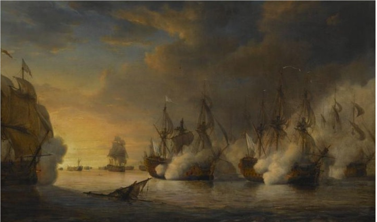
L'Intrépide secourant le Tonnant. La bataille dure plus de sept heures et ne s'achève qu'à la nuit tombante. Elle coûte 6 vaisseaux à la Marine royale.

La guerre, qui a repris entre la France et l'Angleterre en 1744 (guerre de Succession d'Autriche) n'a vu se dérouler sur mer que deux batailles importantes. La première a lieu en 1744 devant Toulon afin de lever le blocus du port — imposé par la flotte de l'amiral Mathews — et d'en dégager une escadre espagnole qui s'y était réfugiée. Après cet affrontement, la Marine française, qui combat avec des effectifs très inférieurs à ceux de la Royal Navy — 51 vaisseaux contre 120 en 1744, sans compter les frégates — a réussi à éviter les grands engagements pour préserver les liaisons avec les possessions coloniales des Antilles, d'Amérique, d'Afrique et des Indes. Les Français ont donné la priorité à l'escorte des convois marchands ou de transports de troupes, organisés par le ministre de la marine, Maurepas. Ces missions ont été remplies avec succès de 1744 à 1747, au point que les chambres de commerce des ports ont adressé des félicitations aux officiers de la Marine de guerre, note l'historien Patrick Villiers.