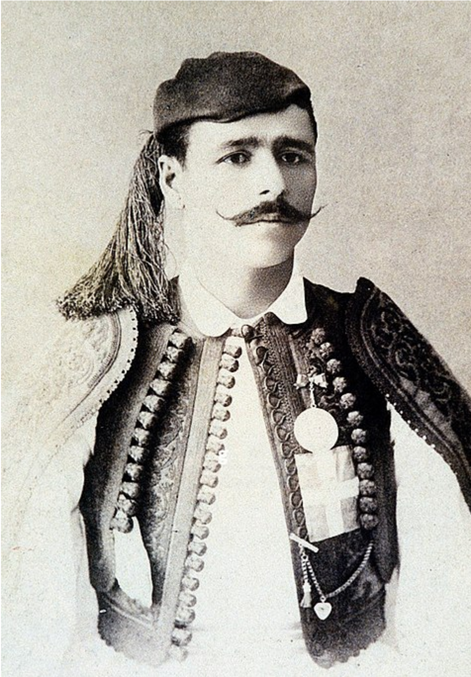
athlète grec qui fut le premier champion du marathon lors des Jeux olympiques de 1896 en remportant l'épreuve de 38 kilomètres en 2 h 58 min 50 s.