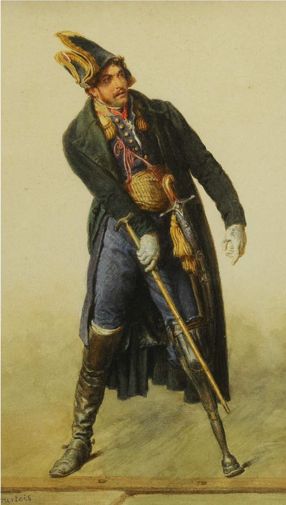
Grièvement blessé au