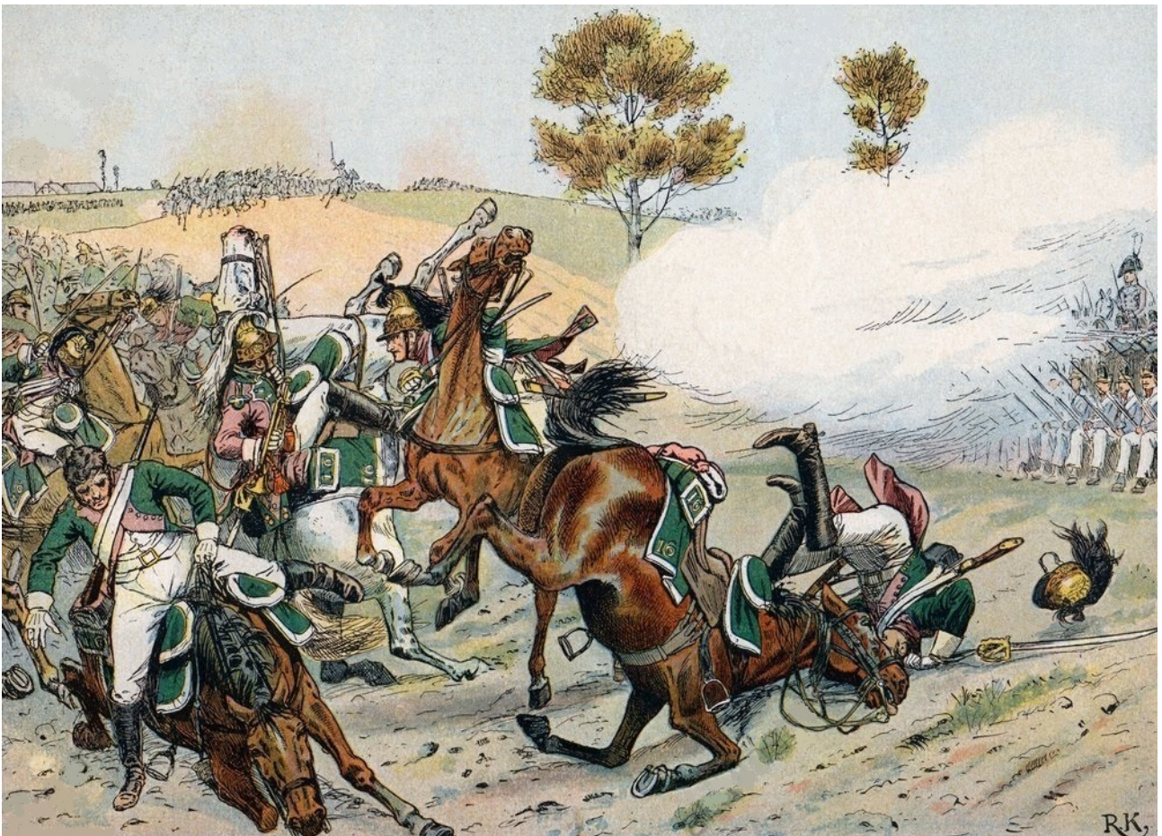
Combat de Prentzlow par Richard Knötel.

À Prentzlow, les dragons de la Grande Armée, conduits par les généraux Grouchy et Beaumont sont éclairés par la cavalerie légère (la brigade infernale) du général Lassalle et balaient les forces du prince prussien Auguste de Hohenlohe. Tout ce qui avait échappé des Gardes du roi de Prusse à la bataille d'Iéna tombe entre les mains des Français : 16 000 fantassins presque tous gardes ou grenadiers, 6 régiments de cavalerie, 45 drapeaux et 64 pièces d'artillerie attelées (d'après le 22 e bulletin de la Grande Armée).