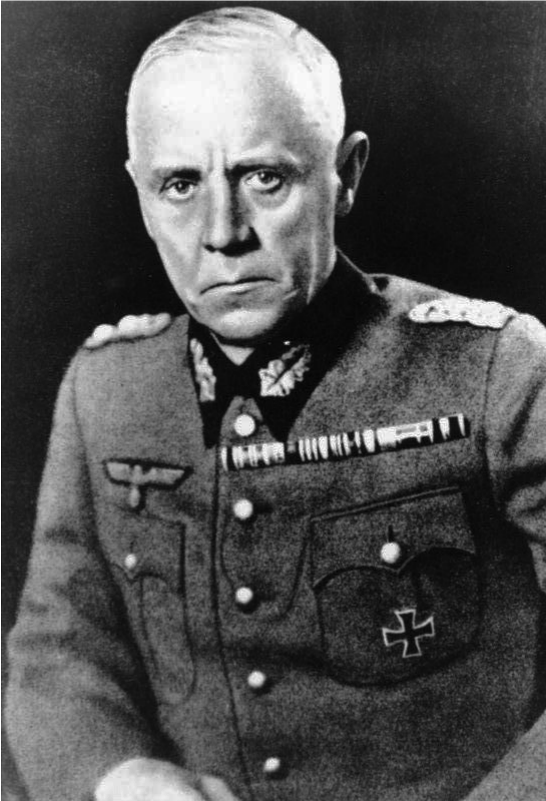
En 1933, il