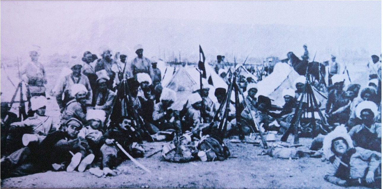
Brigade de volontaires arméniens avant le combat.