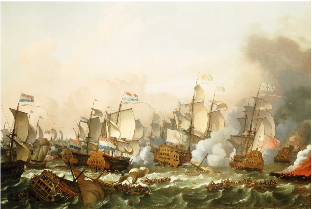
Bataille de Barfleur, par Ludolf Bakhuizen

Lire : Les 600 plus grandes batailles navales de l'histoire - Yves Le Moing.