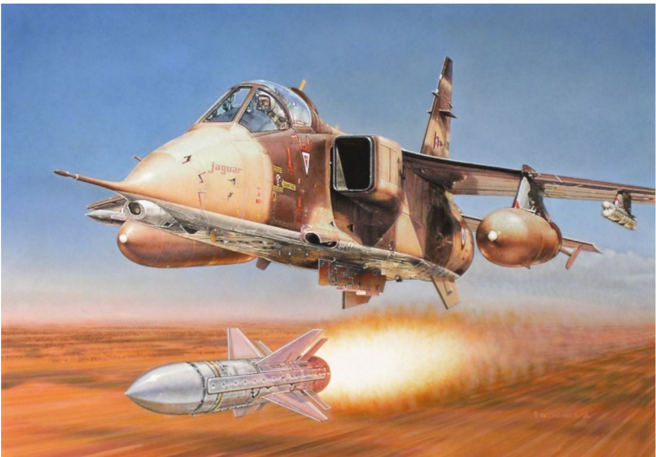
Illustration de Daniel Bechenec.

Conception du missile franco-britannique Martel (air-mer ou air-radar) à guidage TV. C'est l'un de ces missiles, tiré par un avion Jaguar, qui en 1987 détruit les radars sol-air de la base de Ouadi Doum tenue par les Libyens au Tchad.