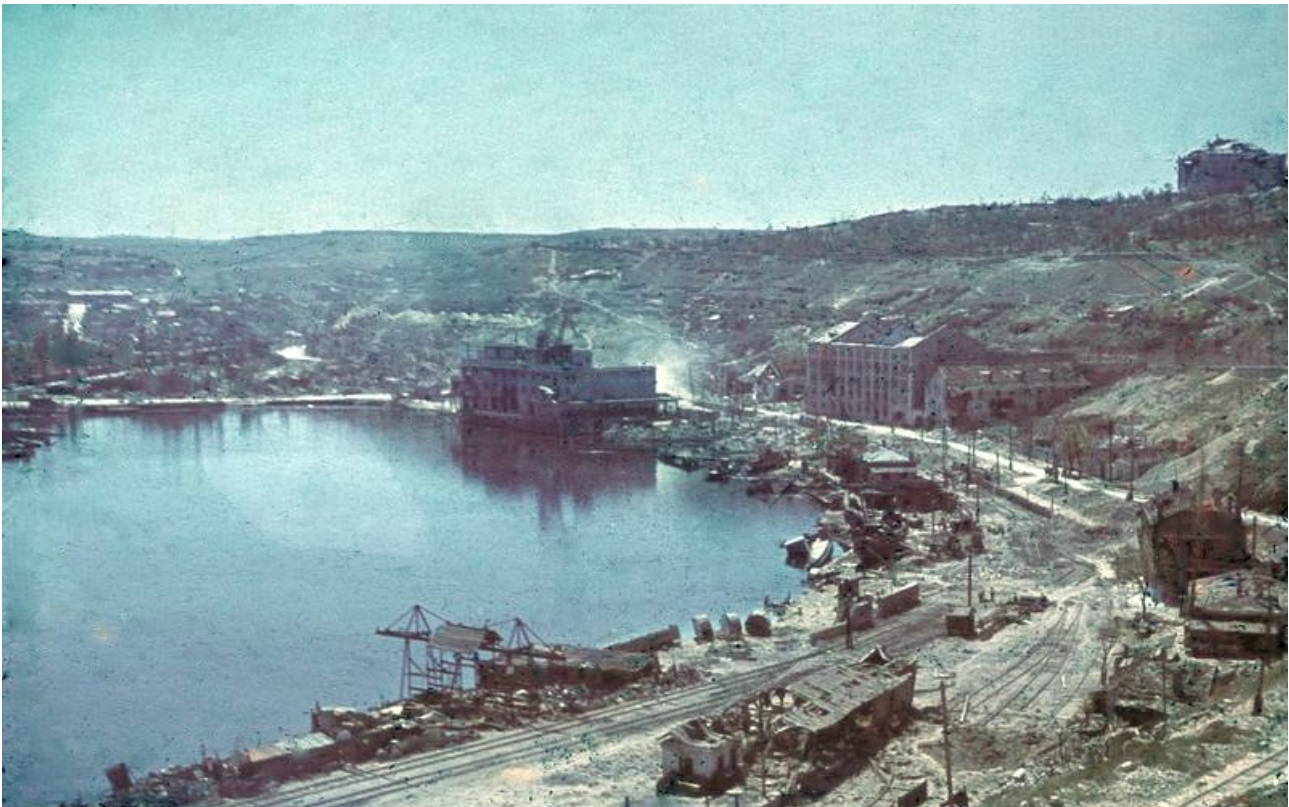
Port de Sébastopol après la bataille en juillet 1942.

Le siège de Sébastopol (du nom de code opération Störfang ) est une bataille de la Seconde Guerre mondiale qui se déroula entre le 30 octobre 1941 et le 4 juillet 1942 entre les forces allemandes et soviétiques. L'enjeu était le port de Sébastopol qui était la principale base navale de la flotte soviétique de la mer Noire. Il résulte en une victoire allemande et la prise de la ville portuaire mais au prix de pertes importantes et d'une mobilisation de troupes pendant plusieurs mois qui feront défaut pour les autres offensives allemandes du sud du front de l'Est.