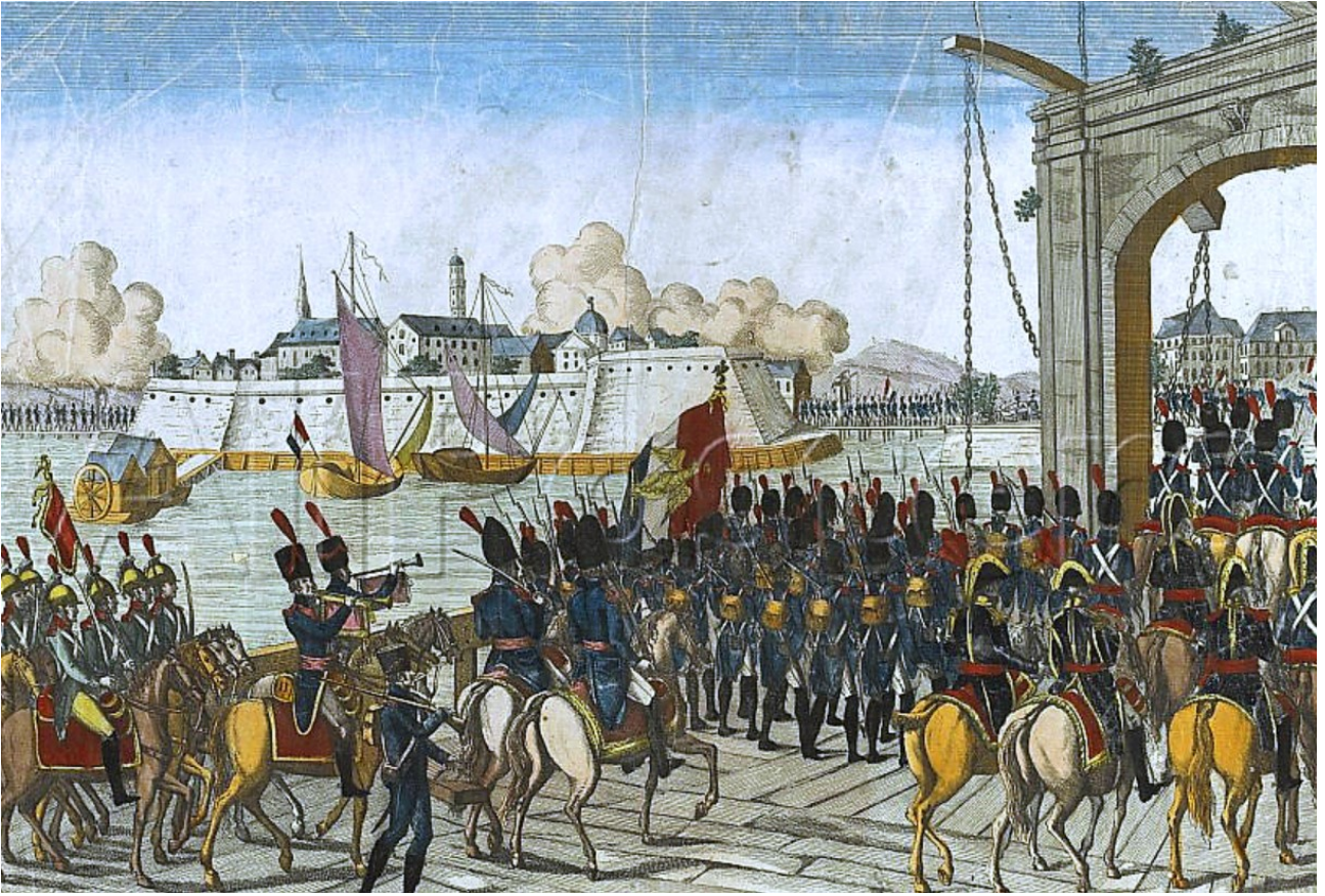
30 octobre 1813 : bataille de Hanau (Allemagne).