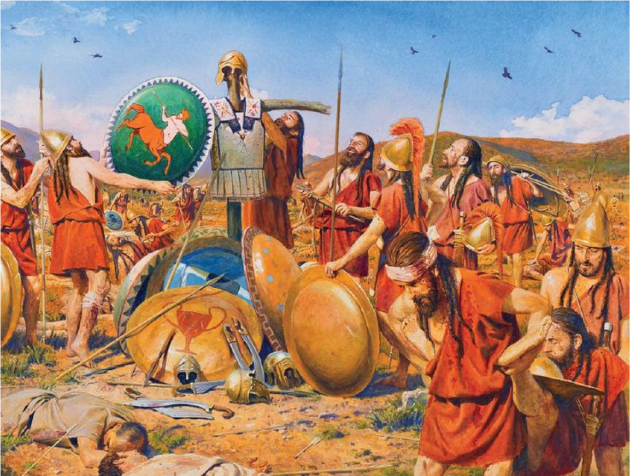
Après la bataille de Mantinée