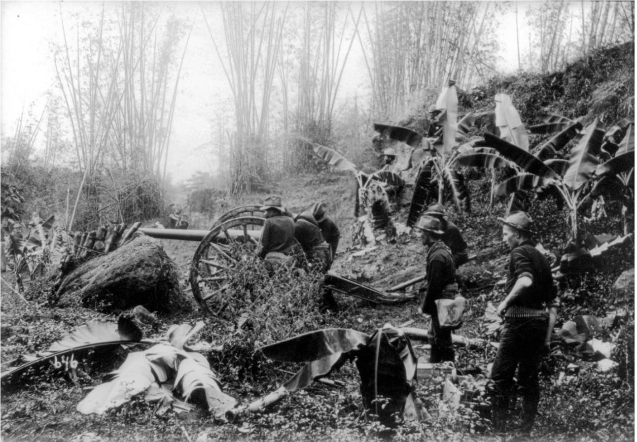
Soldats américains aux Philippines.