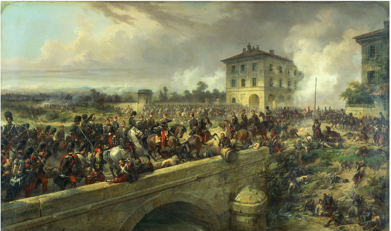
La Garde impériale à Magenta, le 4 juin 1859, huile sur toile de Eugène-Louis Charpentier, musée de l'armée, 1860.

l'ennemi retranché dans la ville. Au soir du 4 juin, l'empereur Napoléon III nomme Mac Mahon maréchal de France et duc de Magenta.