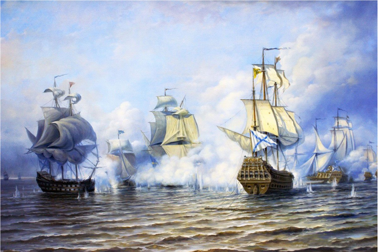
Bataille de l'île d'Ösel, par Alexei Bogolioubov (1824-1896).