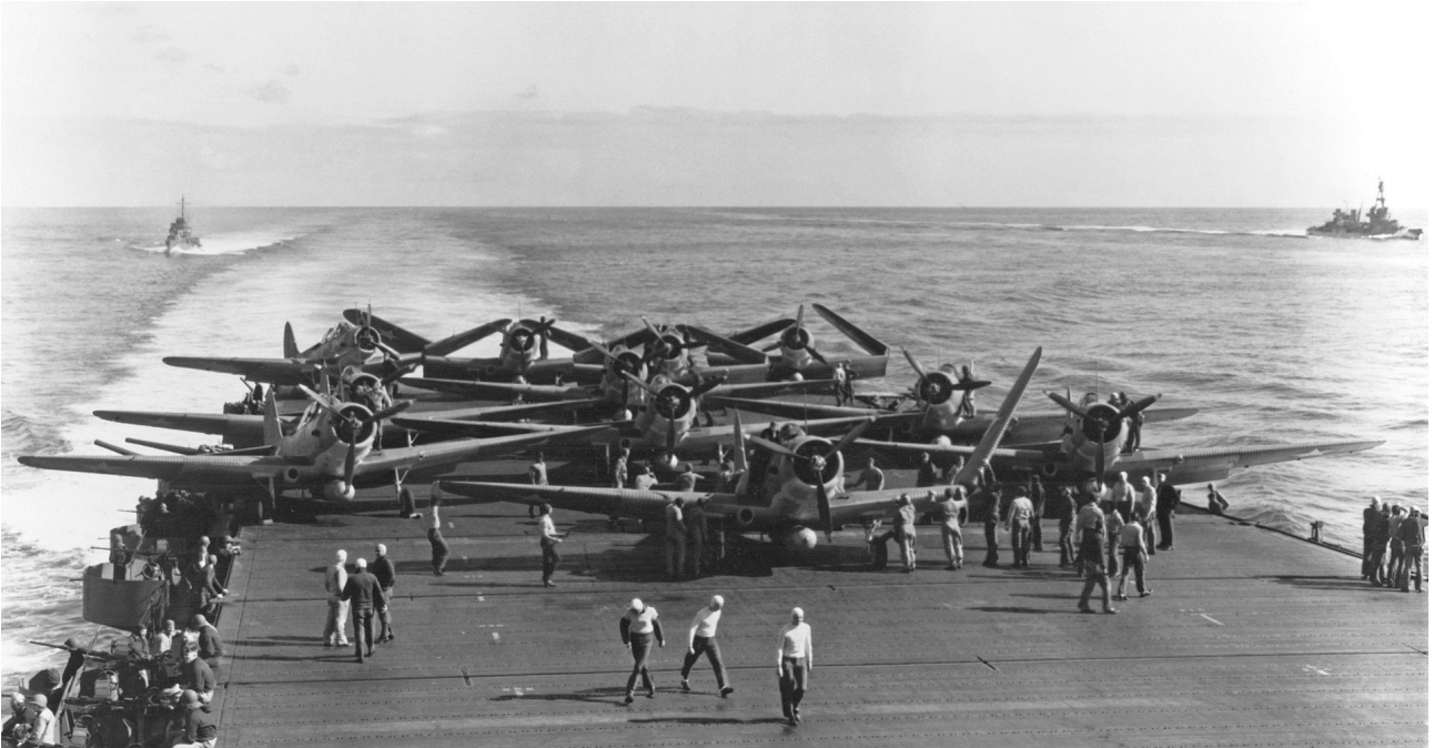
Des TBD Devastator de la VT-6 à bord de l'USS Enterprise se préparant à décoller durant la bataille.