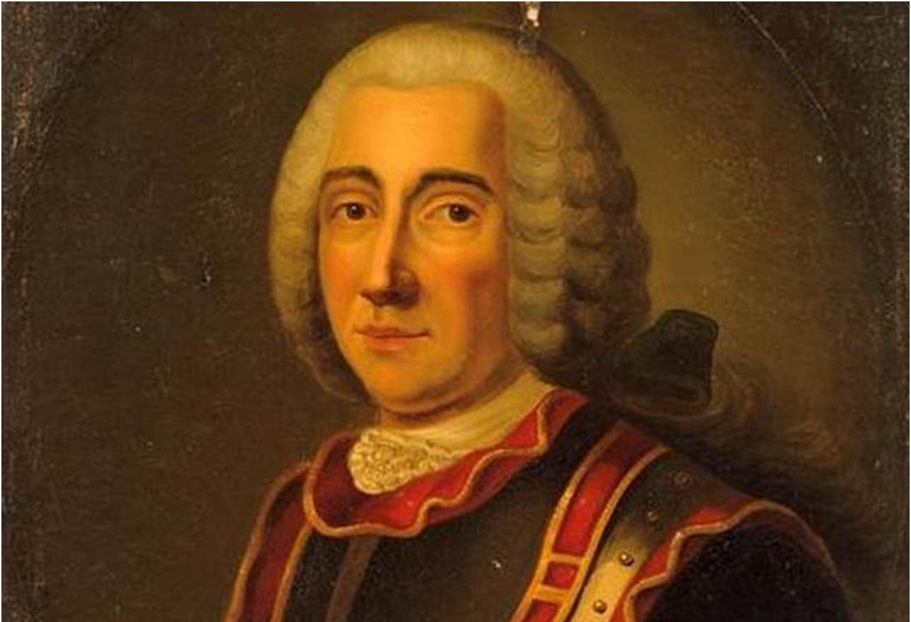
Claude de Forbin (1656-1733)

Ancien mousquetaire, ancien gouverneur de Bangkok et amiral de la flotte siamoise. Héros de la marine française, il s'est entre autres exploits, évadé d'une prison anglaise en traversant la Manche à bord d'un canot en compagnie de Jean Bart. Une frégate de défense aérienne de classe Horizon porte son nom.