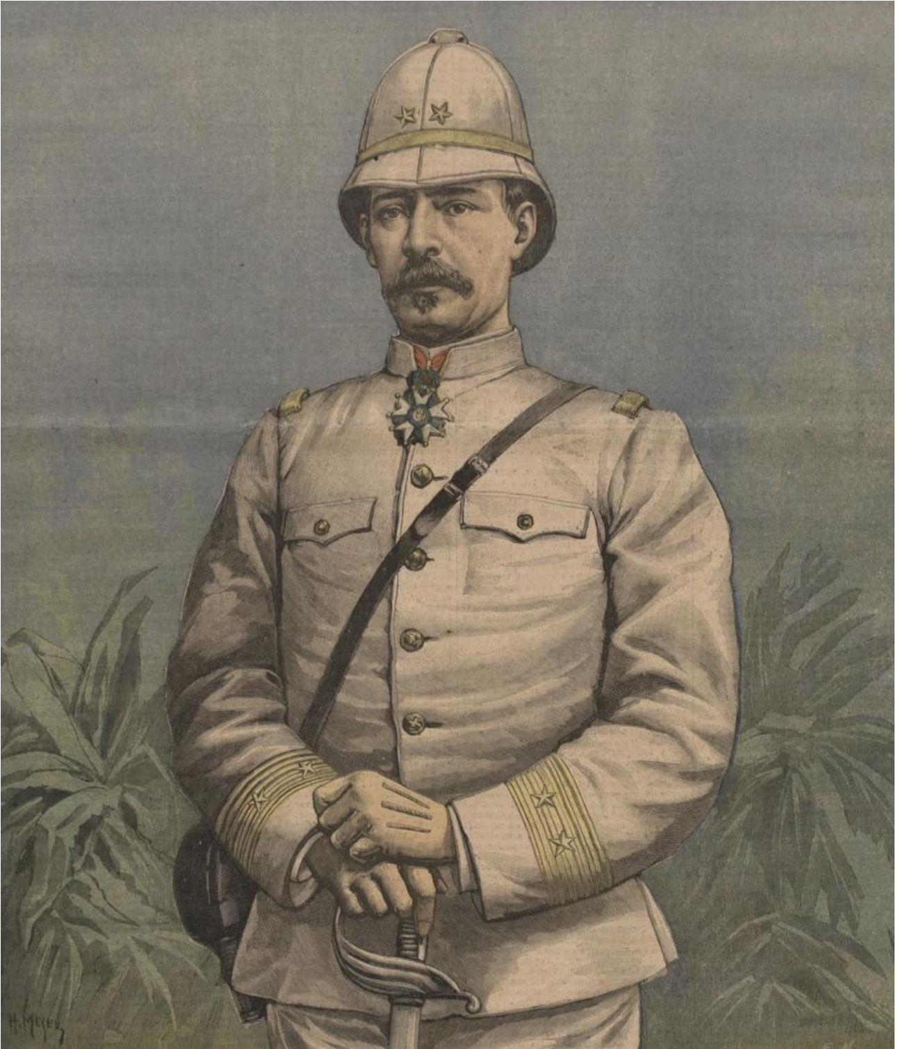
Alfred Amédée Dodds (1842-1922).