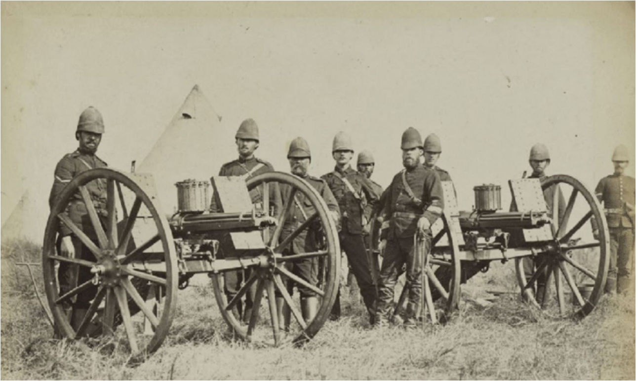
Deux Gatling en Afrique du Sud en 1879.